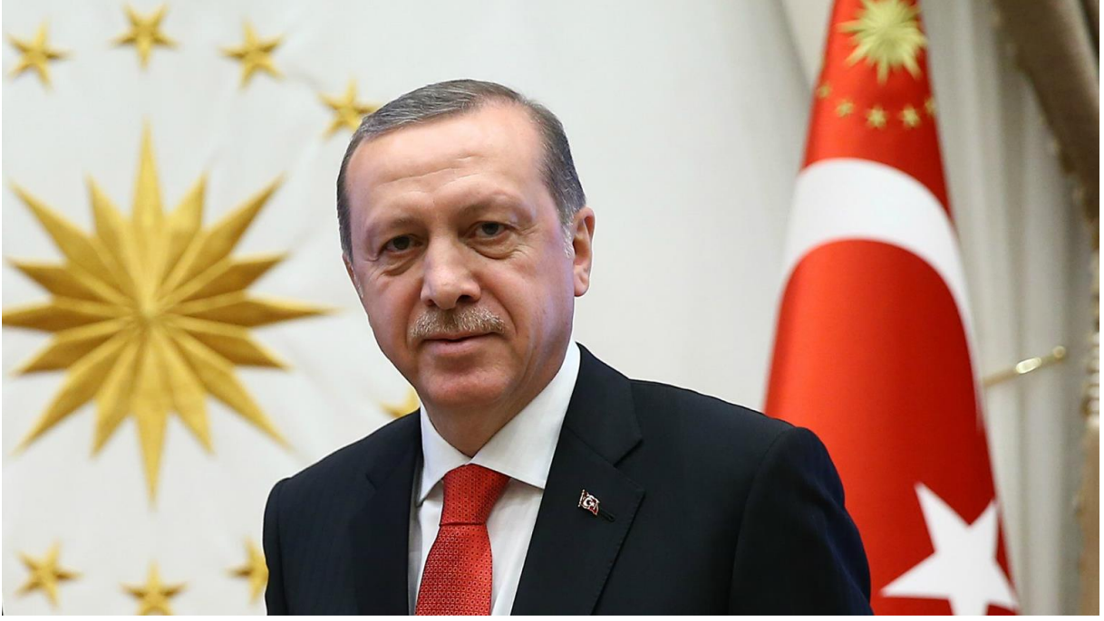
RECEP TAYYİP ERDOĞAN