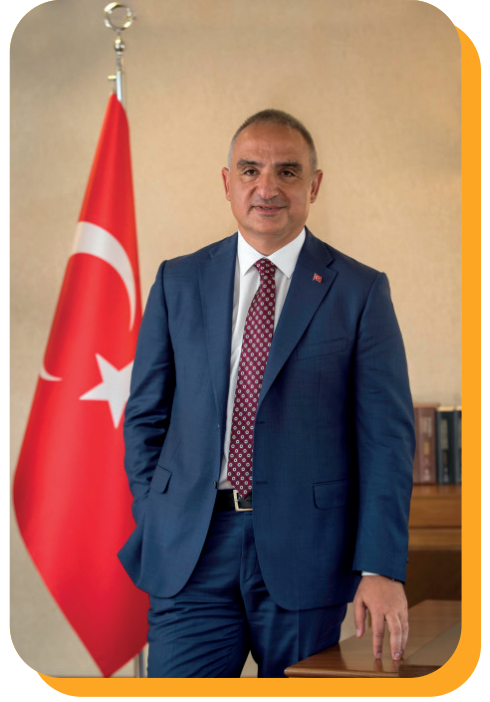
Mehmet Nuri ERSOY Kültür ve Turizm Bakanı

Şeffaflık ve hesap verebilirlik ilkesi doğrultusunda hazırlanan Atatürk Kültür, Dil ve Tarih Yüksek Kurumu 2025 Yılı Performans Programı'nın başarıyla uygulanmasını ve ülkemizin kültürel kalkınmasına katkı sağlamasını temenni ediyorum.