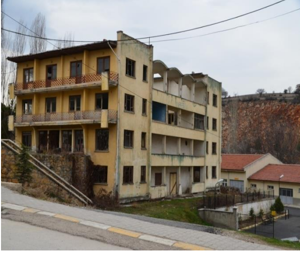
Eski Hükümet Binası