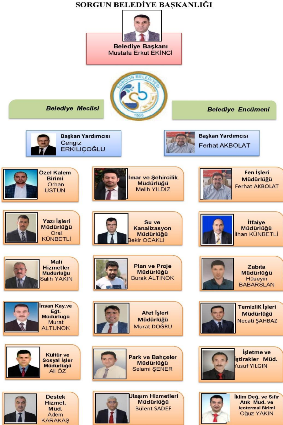
Şekil 1. Teşkilat Şeması

SorgunBelediyesi'nin 2025 yılı itibarı ile yönetim yapısını yansıtan organizasyon şeması aşağıda yer almaktadır.