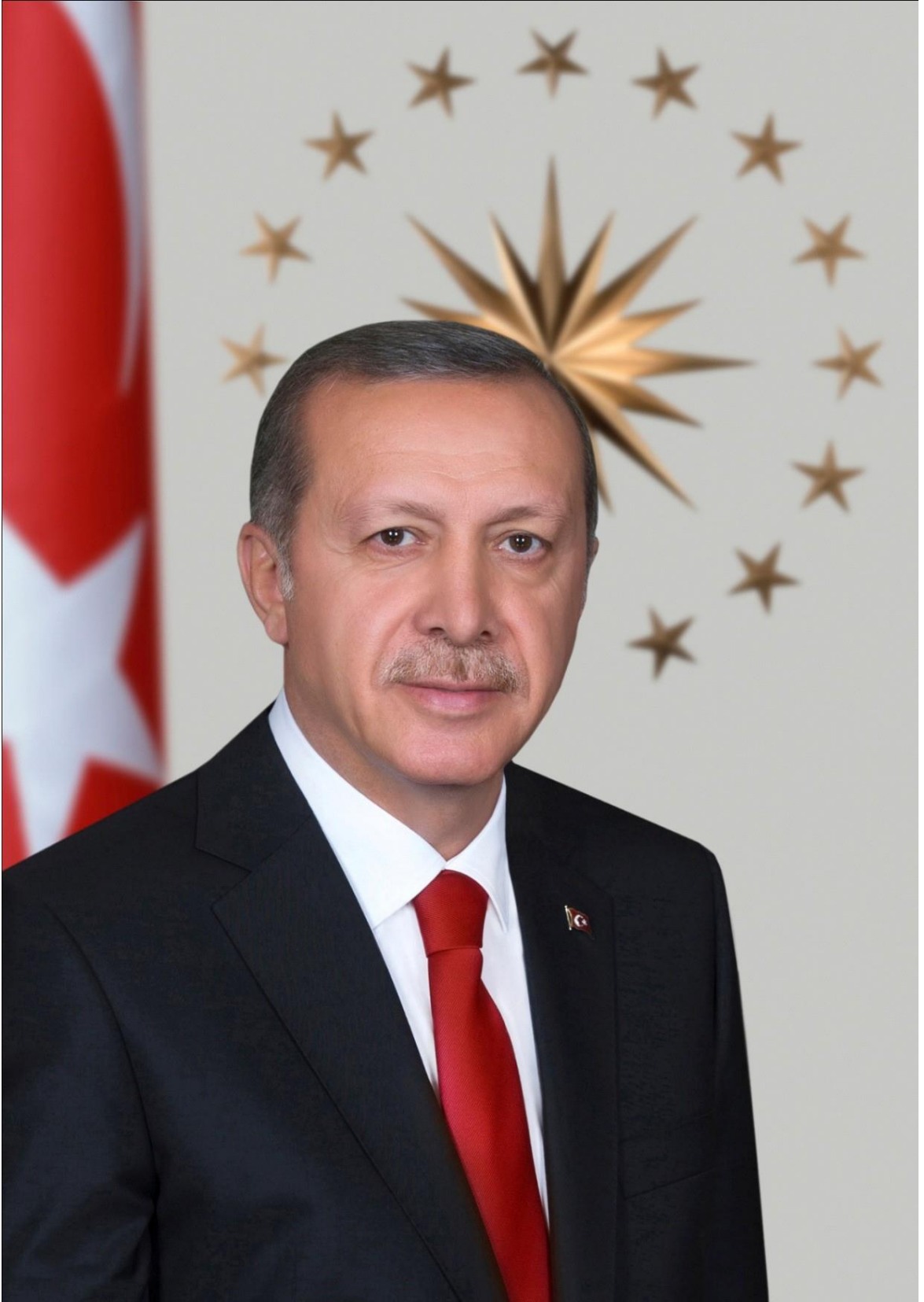
Recep Tayyip ERDOĞAN Türkiye Cumhuriyeti Cumhurbaşkanı