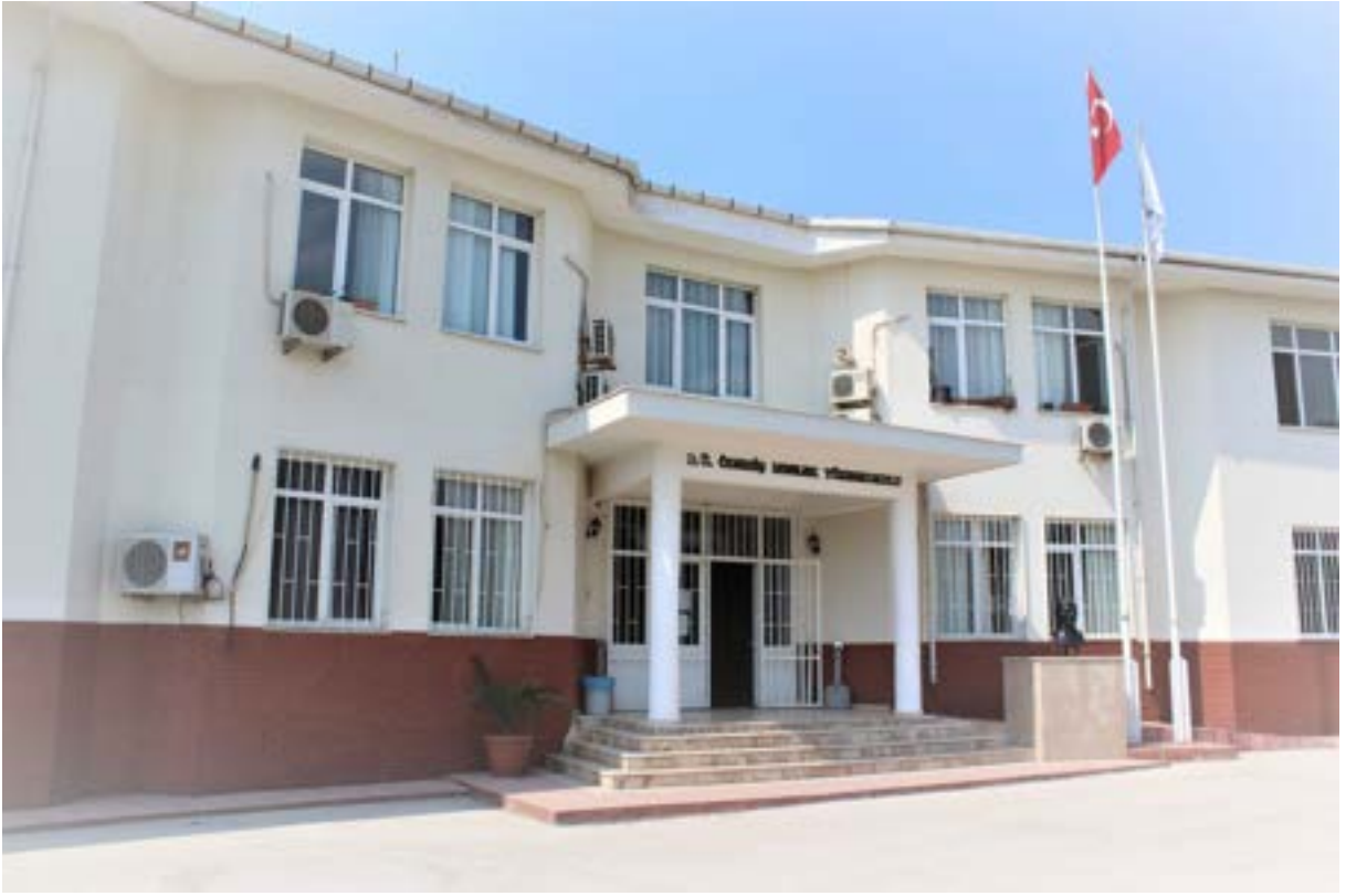
Ödemiş Meslek Yüksekokulu