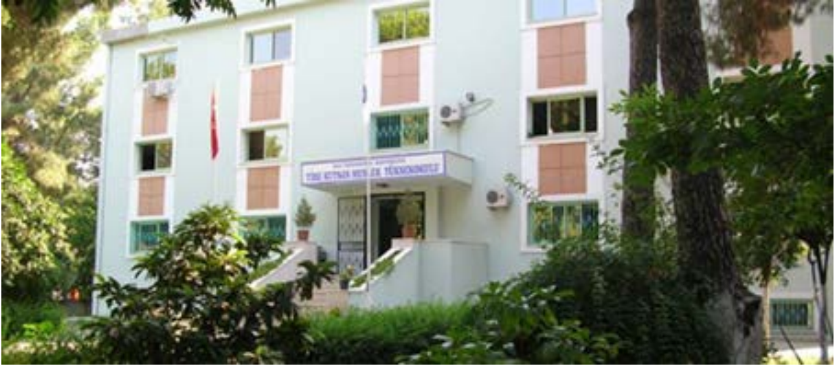
Tire Kutsan Meslek Yüksekokulu