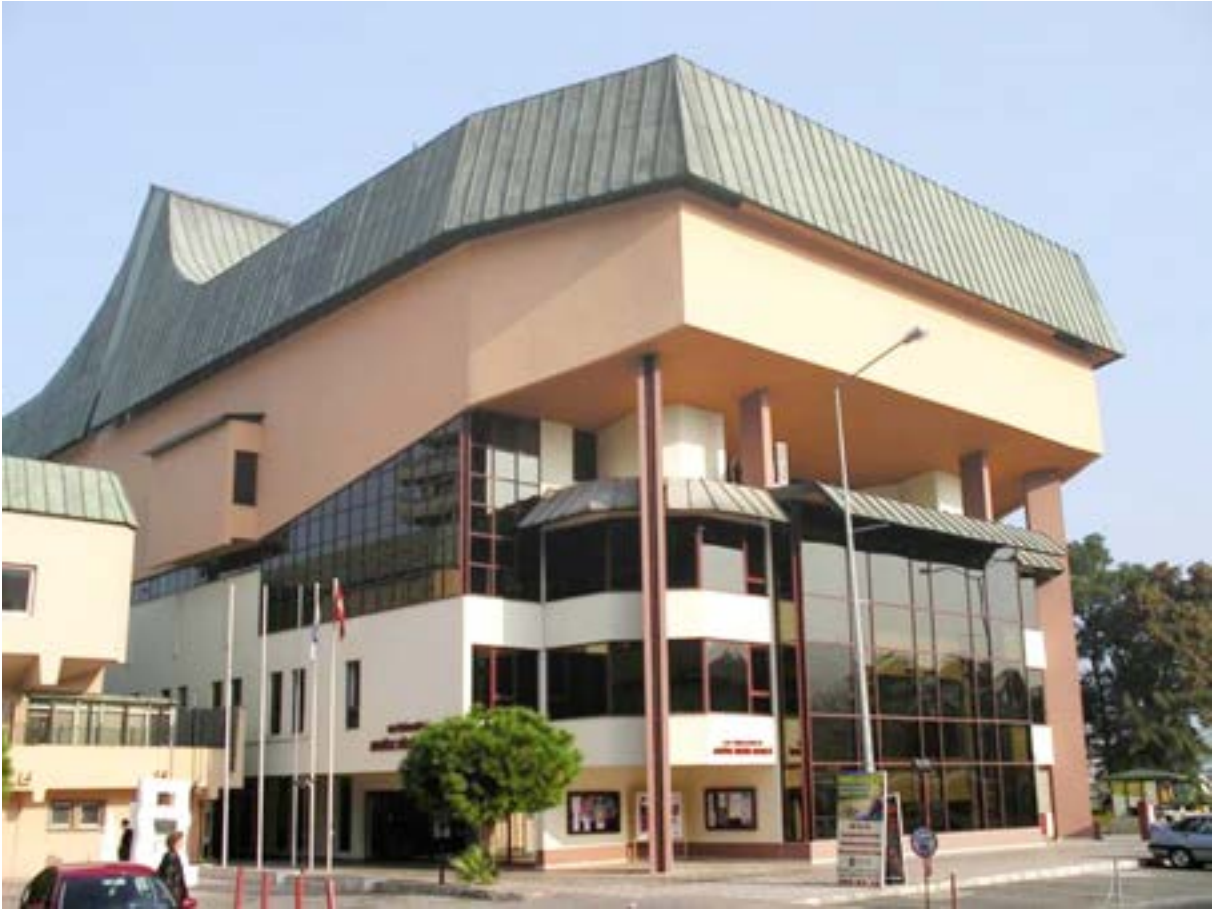
Atatürk Kültür Merkezi (AKM)