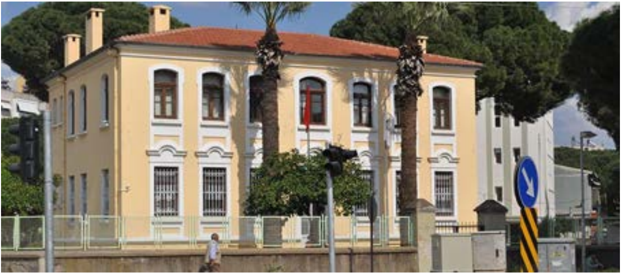
Ödemiş Sağlık Bilimleri Fakültesi