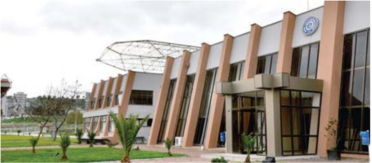
Aliğa Meslek Yüksekokulu