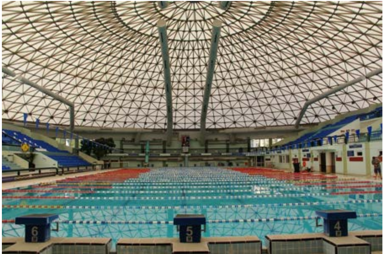
Ege Üniversitesi Kapalı Olimpik Yüzme Havuzu