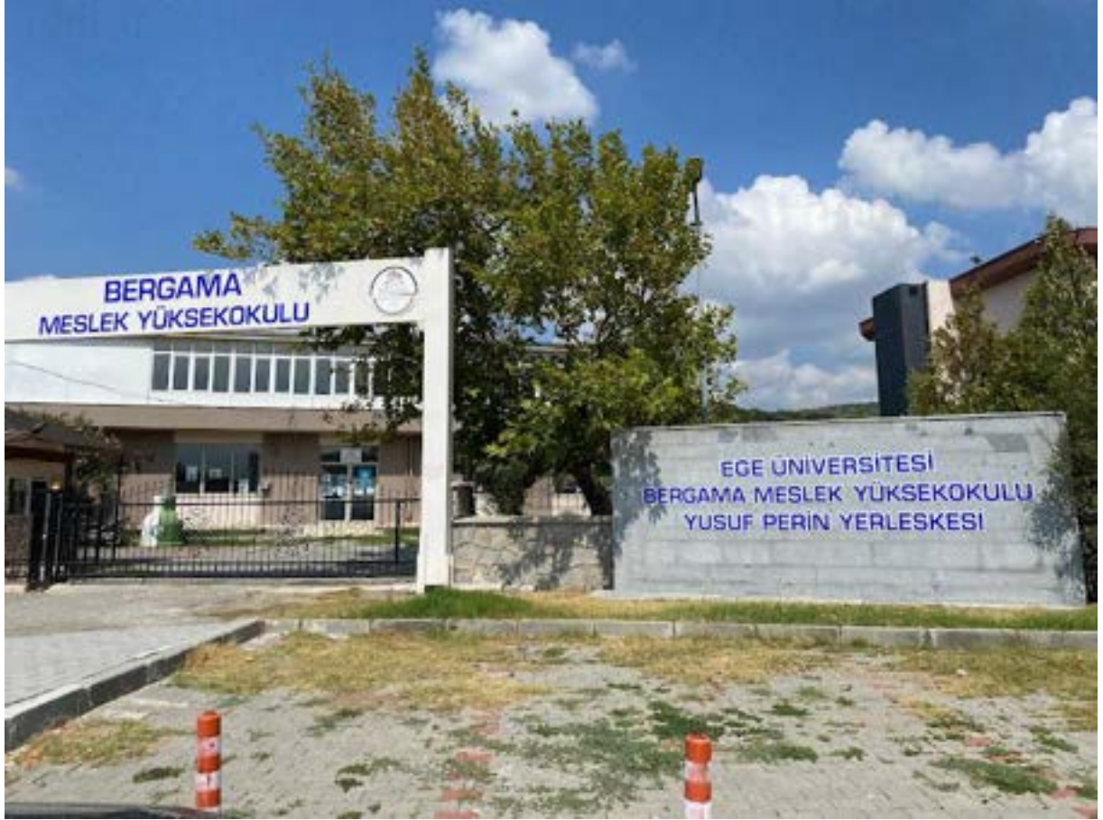
Bergama Meslek Yüksekokulu