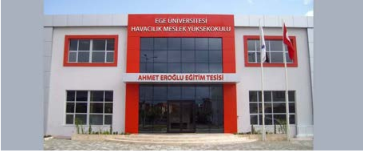
Havacılık Meslek Yüksekokulu (Gazimir ilçesi)