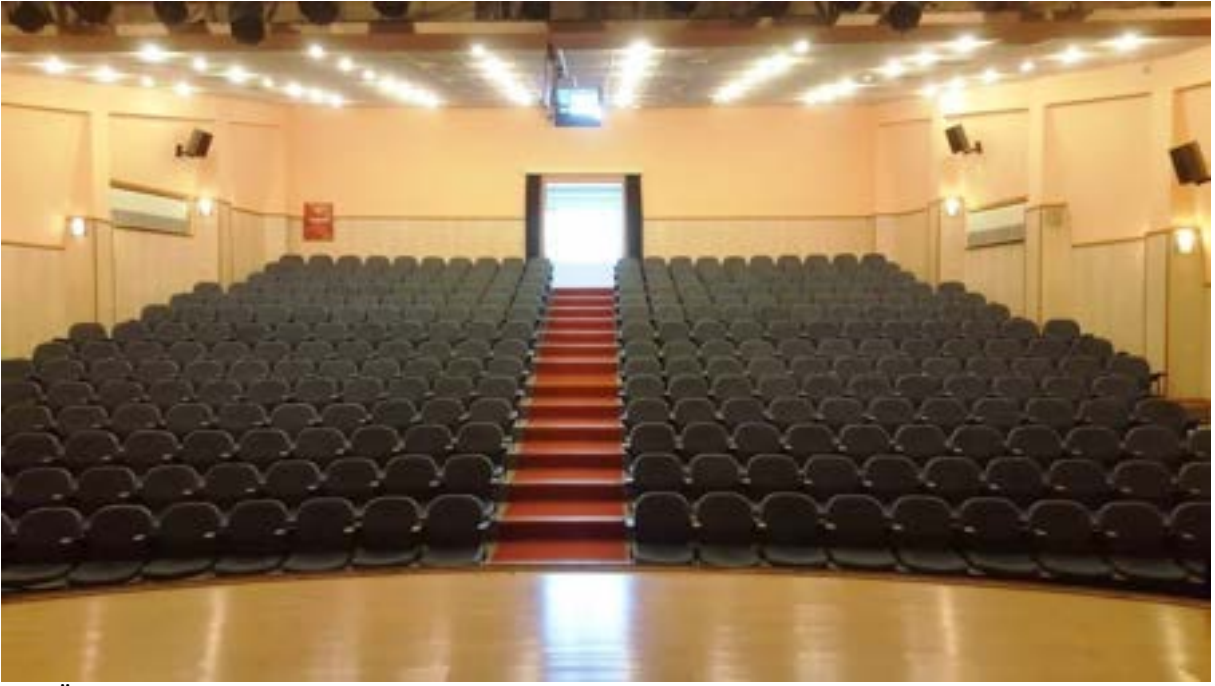
Ege Üniversitesi Kültür Sanat Evi