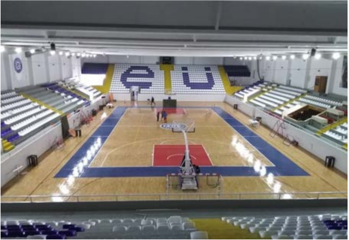
Ege Üniversitesi Büyük Spor Salonu