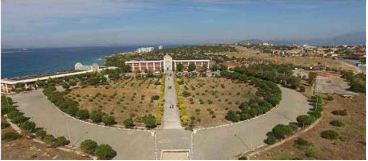
Çeşme Turizm Fakültesi