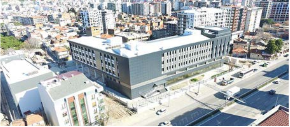
Sağlık Bilimleri Fakültesi (Karşıyaka ilçesi)