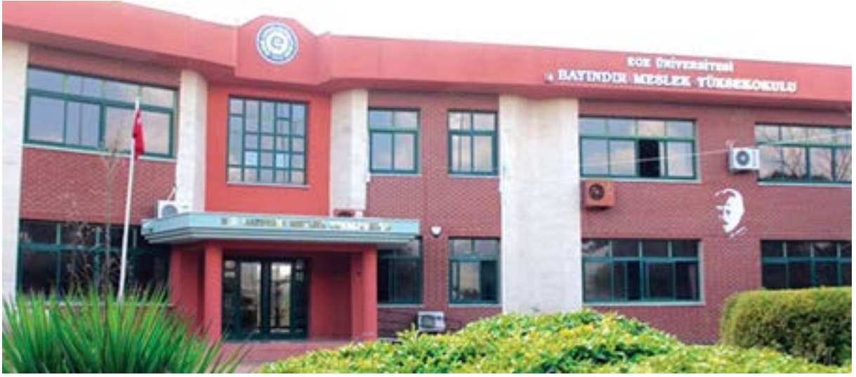
Bayındır Meslek Yüksekokulu