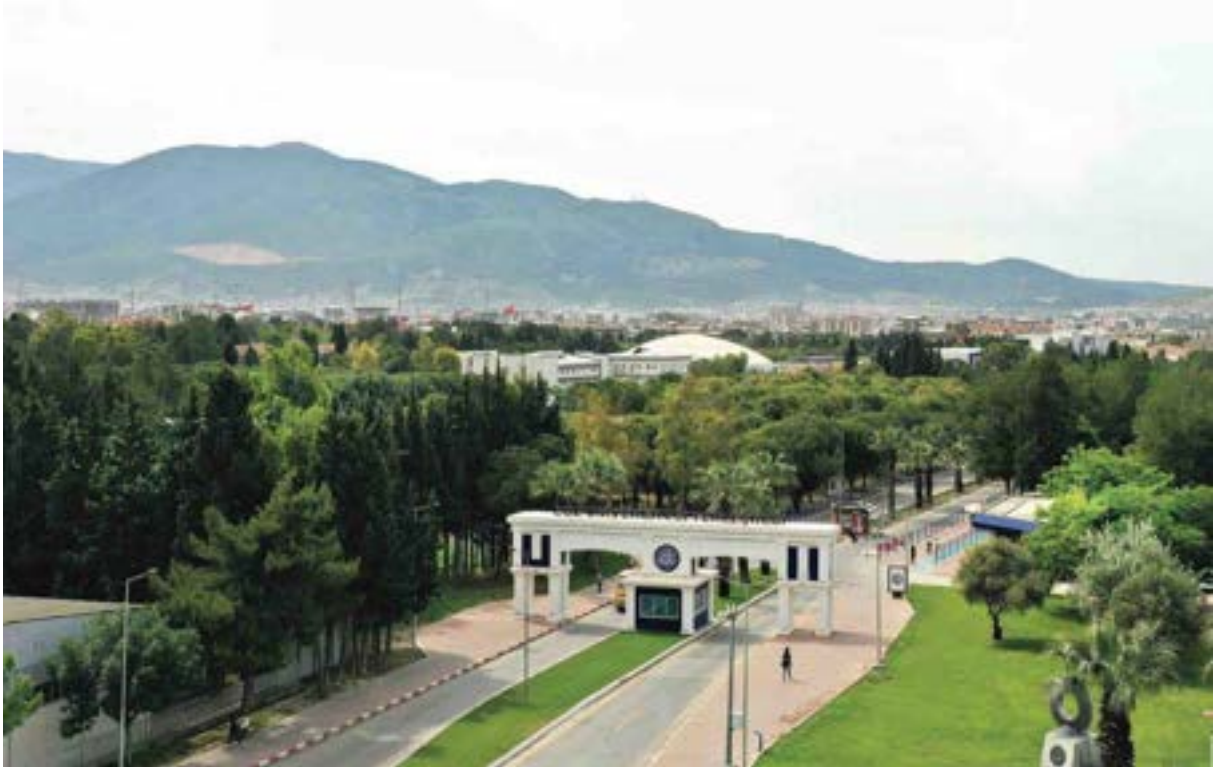
Ege Üniversitesi Bornova Merkez Yerleşkesi Girişi

Üniversitemiz; Rektörlük ve bağlı birimleri (29.828 m 2 ), eğitim alanları (480.740 m 2 ), sosyal ve kültürel alanları (85.255 m 2 ), spor alanları (27.962 m 2 ) ve sağlık alanları (290.779 m 2 ) olmak üzere toplam 914.564 m 2 kapalı alana sahiptir.