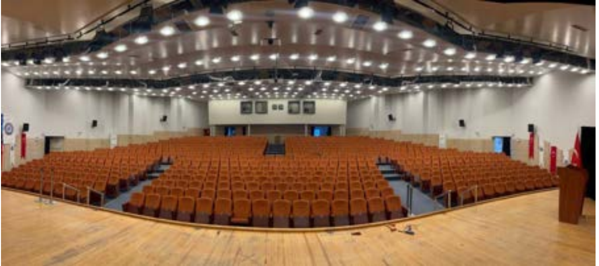
Ege Üniversitesi Prof. Dr. Yusuf VARDAR-MÖTBE- Kültür Merkezi