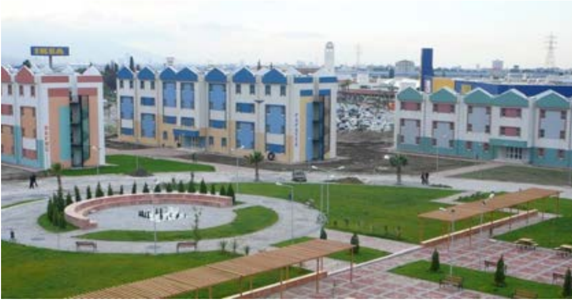
Ege Üniversitesi Öğrenci Köyü