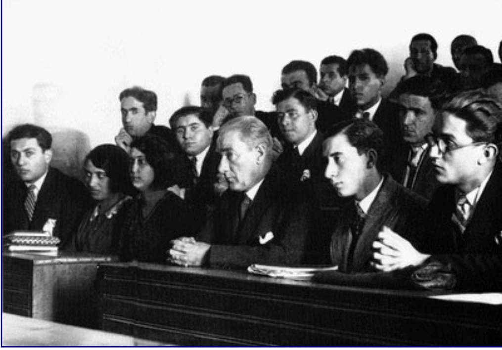
Atatürk, İstanbul Üniversitesi Hukuk Fakültesinde (15 Aralık 1930)

Hükümet, memlekette yasayı egemen kılmak ve adaleti iyi dağıtmakla görevlidir. Bu itibarla adalet işi pek önemlidir. Bu sebeple adalet siyasetimizi de açıklamayı faydalı buluyorum. Adliye siyasetimizde izlenecek amaç, evvelâ halkı yormaksızın hızla, isabetle, güvenle adaleti dağıtmaktır. İkinci olarak, toplumumuzun bütün dünya ile teması doğal ve zorunludur. Bunun için adalet düzeyimizi, bütün uygar toplumların adalet düzeyi derecesinde bulundurmak zorunluğundayız. Bu hususları karşılamak için mevcut yasa ve usullerimizi, bu görüş noktalarından düzeltmekte ve yenilemekteyiz ve yenileyeceğiz.(1922)