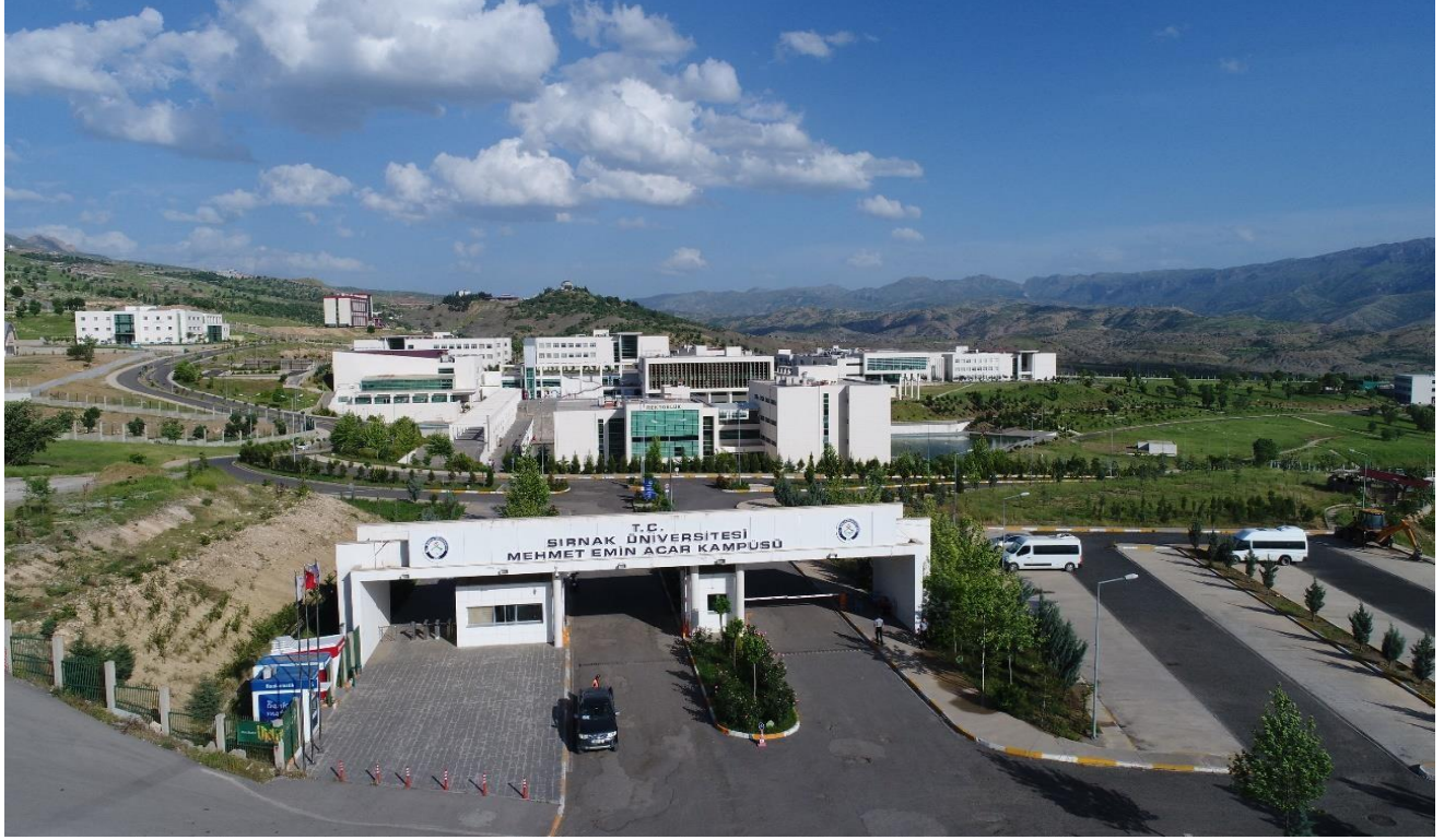
Şekil 1:Kampüs Dış Görünüm