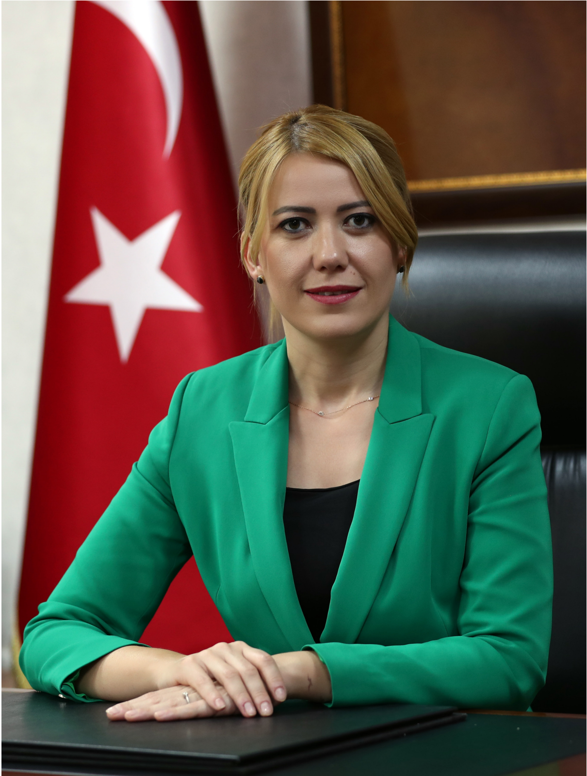
Şeniz DOĞAN Merkezefendi Belediye Başkanı