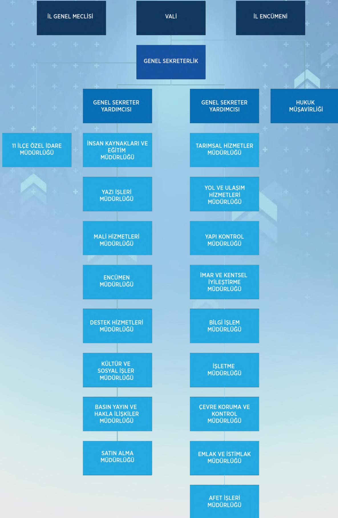
Şekil 1. İl Özel İdaresi Teşkilat Şeması