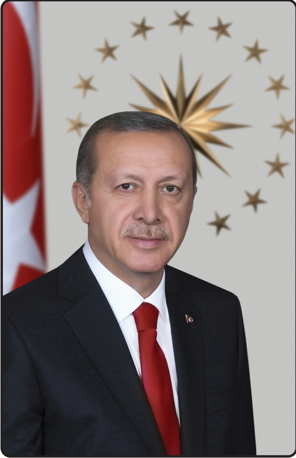
RECEP TAYYİP ERDOĞAN Cumhurbaşkanı