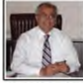
Mustafa GÜLER Şehir Plancısı BELEDİYE BAŞKANI