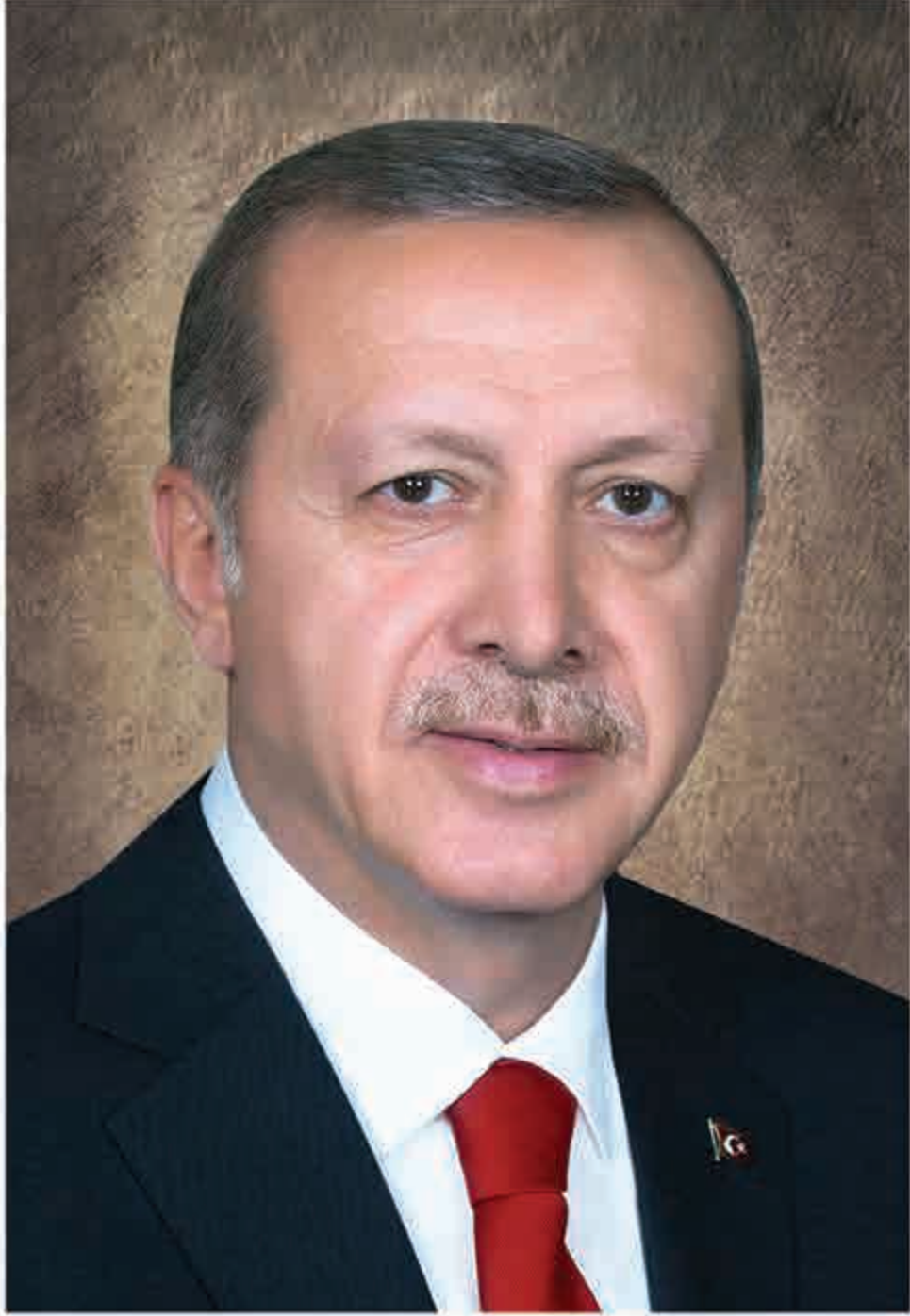
Recep Tayyip ERDOĞAN Türkiye Cumhuriyeti Cumhurbaşkanı