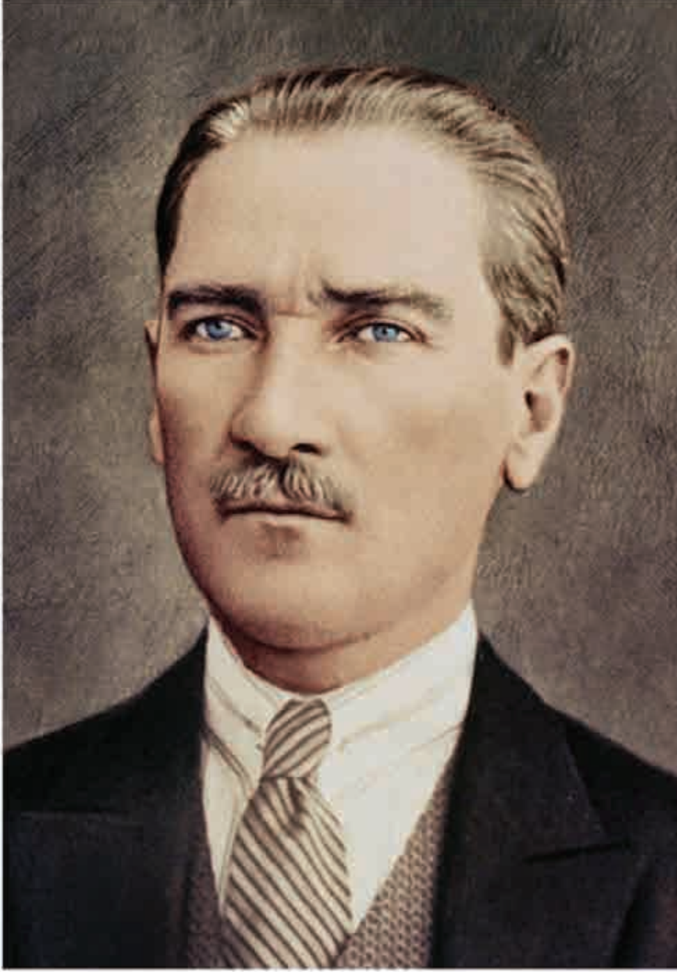
Mustafa Kemal ATATÜRK Türkiye Cumhuriyetinin Kurucusu