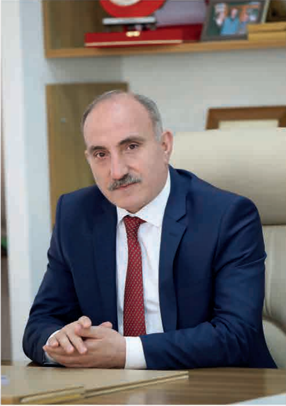
Fevzi KILIÇ Erenler Belediye Başkanı