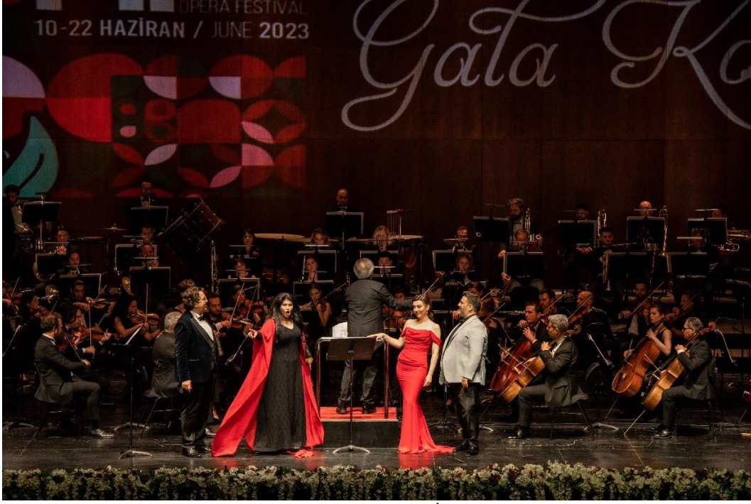
Gala Konseri – 14. Uluslararası İstanbul Opera Festivali