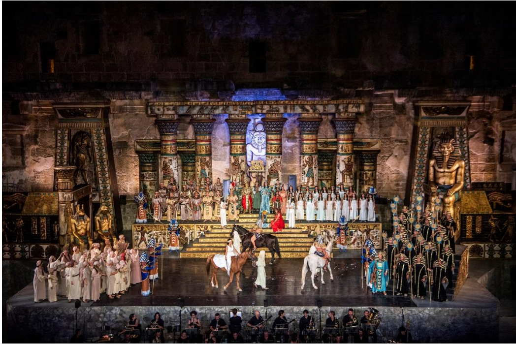
“Aida” Operası – 30. Uluslararası Aspendos Opera ve Bale Festivali

Bunların dışında; Bakanlığımızca düzenlenmiş olan Nevşehir – Kapadokya Balon ve Kültür Yolu Festivali (5-13 Ağustos 2023), Trabzon – Sümela Kültür Yolu Festivali (19-27 Ağustos 2023), Erzurum – Palandöken Kültür Yolu Festivali (19-27 Ağustos 2023), Çanakkale – Troya Kültür Yolu Festivali (9-17 Eylül 2023), Ankara – Başkent Kültür Yolu Festivali (16 Eylül-1 Ekim 2023), Beyoğlu Kültür Yolu Festivali (30 Eylül-15 Ekim 2023), Diyarbakır – Sur Kültür Yolu Festivali (14-22 Ekim 2023), İzmir – Efes Kültür Yolu Festivali (28 Ekim-5 Kasım 2023) ve Antalya Kültür Yolu Festivali 'ne (4-12 Kasım 2023) katılım sağlanmıştır.