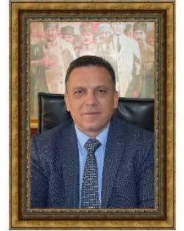
Recep TETİK AK PARTİ