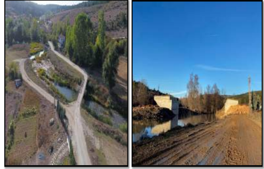
SAFRANBOLU İLÇESİNDE 16 KÖYÜ İLGİLENDİREN DEĞİRMENCİK KÖYÜ KÖPRÜSÜ

21.10.2022 TARİHİNDE İHALESİ YAPILAN İŞİN MALİYETİ 3.510.556,00 TL