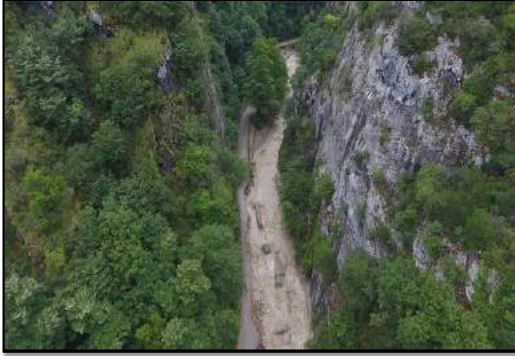
YENİCE İLÇESİ ŞEKER KANYONU İSTİNAT DUVARI YAPIM İŞİ

24.10.2022 TARİHİNDE İHALESİ YAPILAN İŞİN MALİYETİ 3.391.095,00 TL