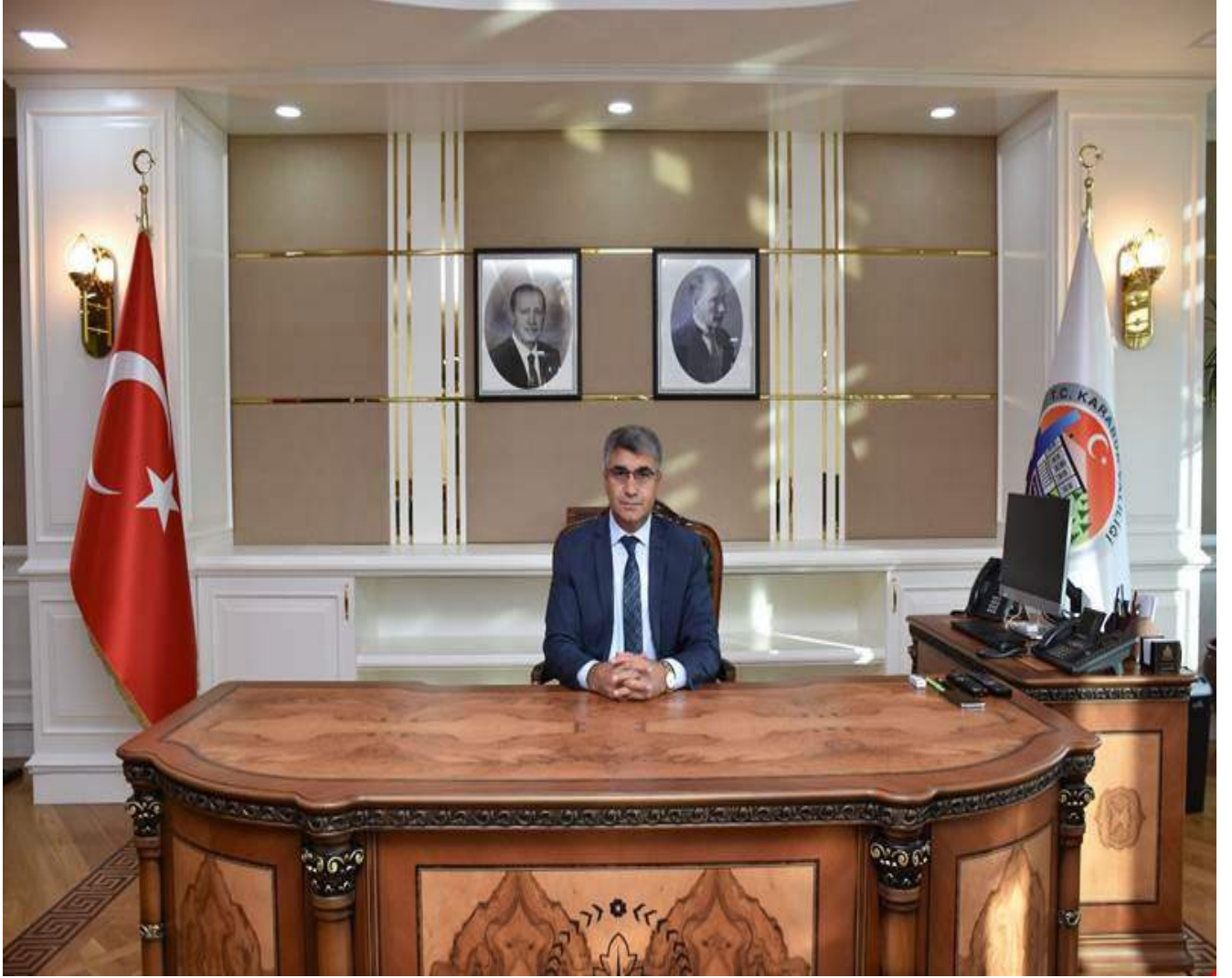
FUAT GÜREL VALİ