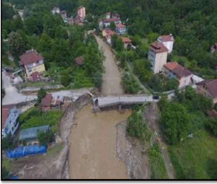
YENİCE İLÇESİ GÜNEY-TIR KÖYÜ KÖPRÜSÜ

21.10.2022 TARİHİNDE İHALESİ YAPILAN İŞİN MALİYETİ 6.800.888,00 TL