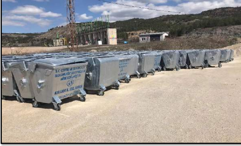
Resim 6: 2022 yılında Çevre, Şehircilik ve İklim Değişikliği Bakanlığı tarafından hibe edilen 432 (Dört yüz otuz iki) adet galvanize sac konteyner