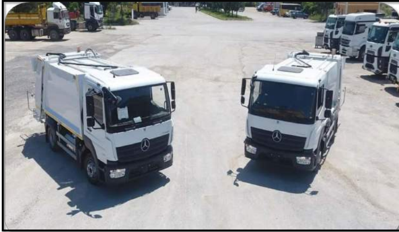
Resim 5: 2022 yılında Çevre, Şehircilik ve İklim Değişikliği Bakanlığı tarafından hibe edilen 2(iki) adet Mercedes Atego 8+1 Çöp kamyonu