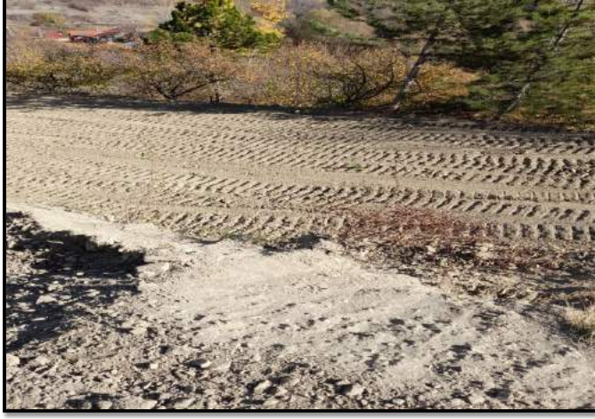
Resim 3: Merkez ilçe Tandır köyü Kadıoğlu mahallesinde tesviye çalışması tamamlanmış sulama havuzu proje alanı