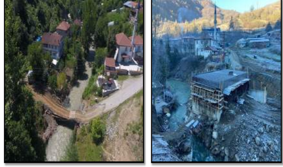
YENİCE İLÇESİ İNCEBACAKLAR KÖPRÜSÜ

21.10.2022 TARİHİNDE İHALESİ YAPILAN İŞİN MALİYETİ 2.870.571,00 TL