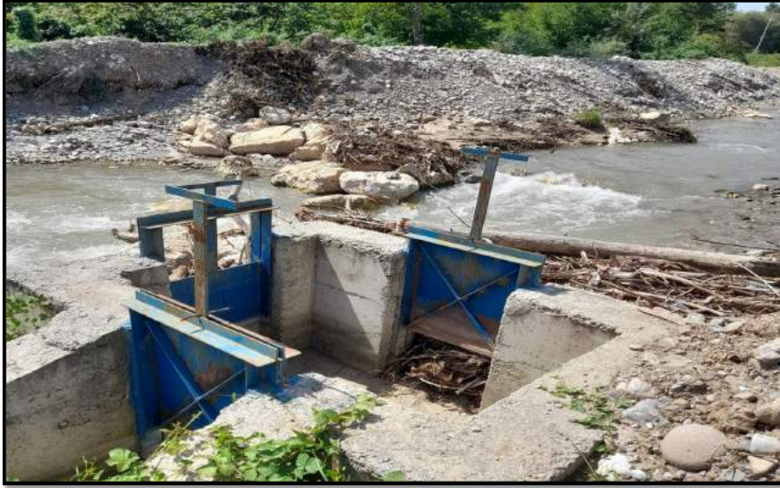
Resim 1: Eskipazar ilçesi Üçevler köyü sulama tesisinin selden zarar gören su alma yapısının yer aldığı Karahasanlar köyü hudutlarından geçen Eskipazar çayı üzerinde tahkimat çalışma alanı.