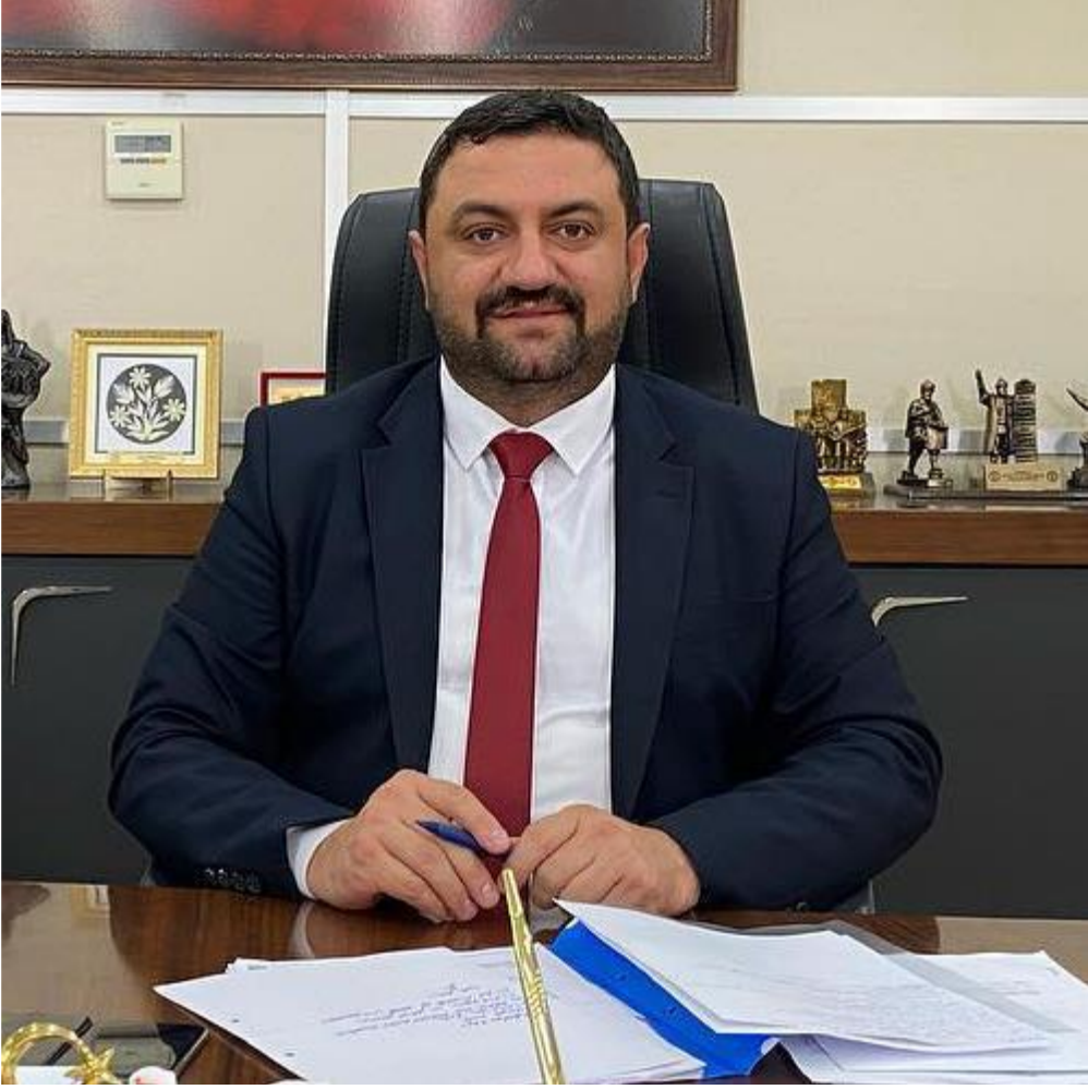
VOLKAN ŞEKER BELEDİYE BAŞKANI