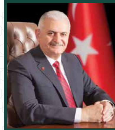
Binali YILDIRIM Türkiye Cumhuriyeti Başbakanı