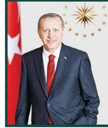
Recep Tayyip ERDOĞAN Türkiye Cumhuriyeti Cumhurbaşkanı

Ünlü süvarileri harp meydanlarında kahramanca dövüşen Türk yiğitlerinin harman olduğu diyar! Bozok Yaylası'nın çocukları, var olun!