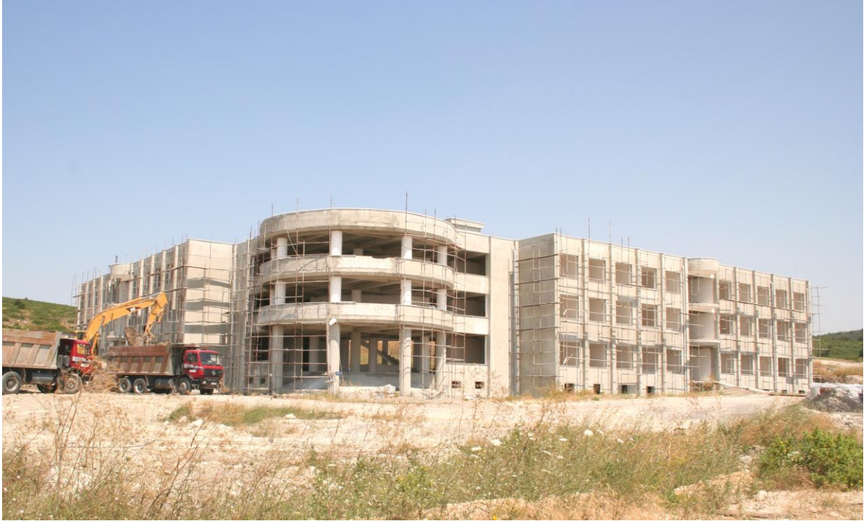
Mediko-Sosyal Sağlık Merkezi İnşaatı ( 50 Yataklı Hastane)

2001 yılında 3 blok ve 6.500 m2 kapalı alana sahip olacak şekilde ihalesi yapılan Mediko-Sosyal Sağlık Merkezi İnşaatının 2005 yılında kaba inşaatı tamamlanmıştır. İnce işleri tamamlanarak 2007 yılında hizmete açılması planlanmıştır. Ancak 2006 yılında Tıp Fakültesinin kurulması sonucu şehir merkezindeki hastanelerin tıp fakültesi hastanesine çevrilmesi uygun görülmediğinden kampus alanında Tıp Fakültesi inşaatı yapıp tamamlanana kadar Tıp Fakültesinin ön ünitelerini oluşturabilmek amacıyla Mediko-Sosyal Sağlık Merkezi İnşaatı 50 yataklı hastaneye dönüştürülmüştür. İnşaata, yapılan revizyonlar doğrultusunda devam edilmektedir. 2007 yılında 50 yatak kapasiteli Tıp Fakültesinin ön ünitesi olarak bitirilmesi planlanmaktadır.