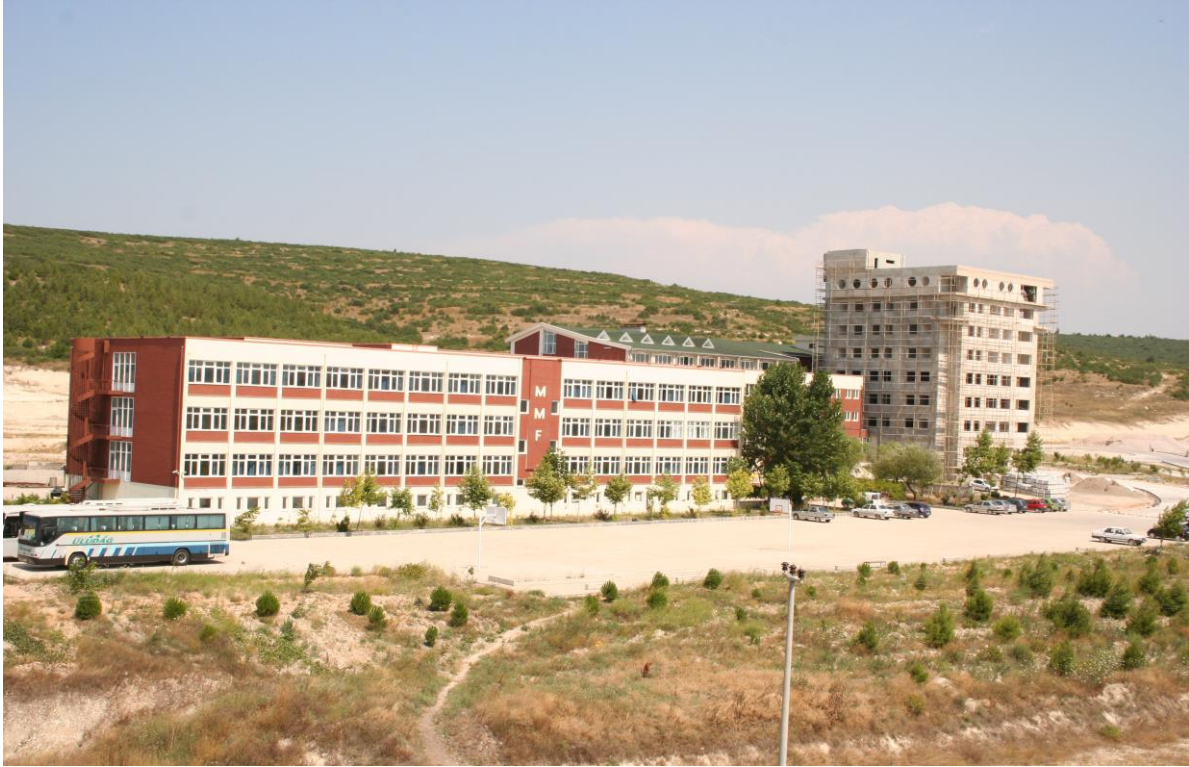
Mühendislik - Mimarlık Fakültesi İnşaatı

2002 yılında söz konusu işin ikmal ihalesi yapılmış olup, 2003,2004,2005 yıllarında ayrılan ödeneklerin yetersiz olması nedeniyle ancak İdari (Dekanlık ) bloğunun yapımına devam edilmiştir. 2006 yılında yine Dekanlık Bloğunun ince işleri bitirildi ve çevre düzenlemesi yapıldı.