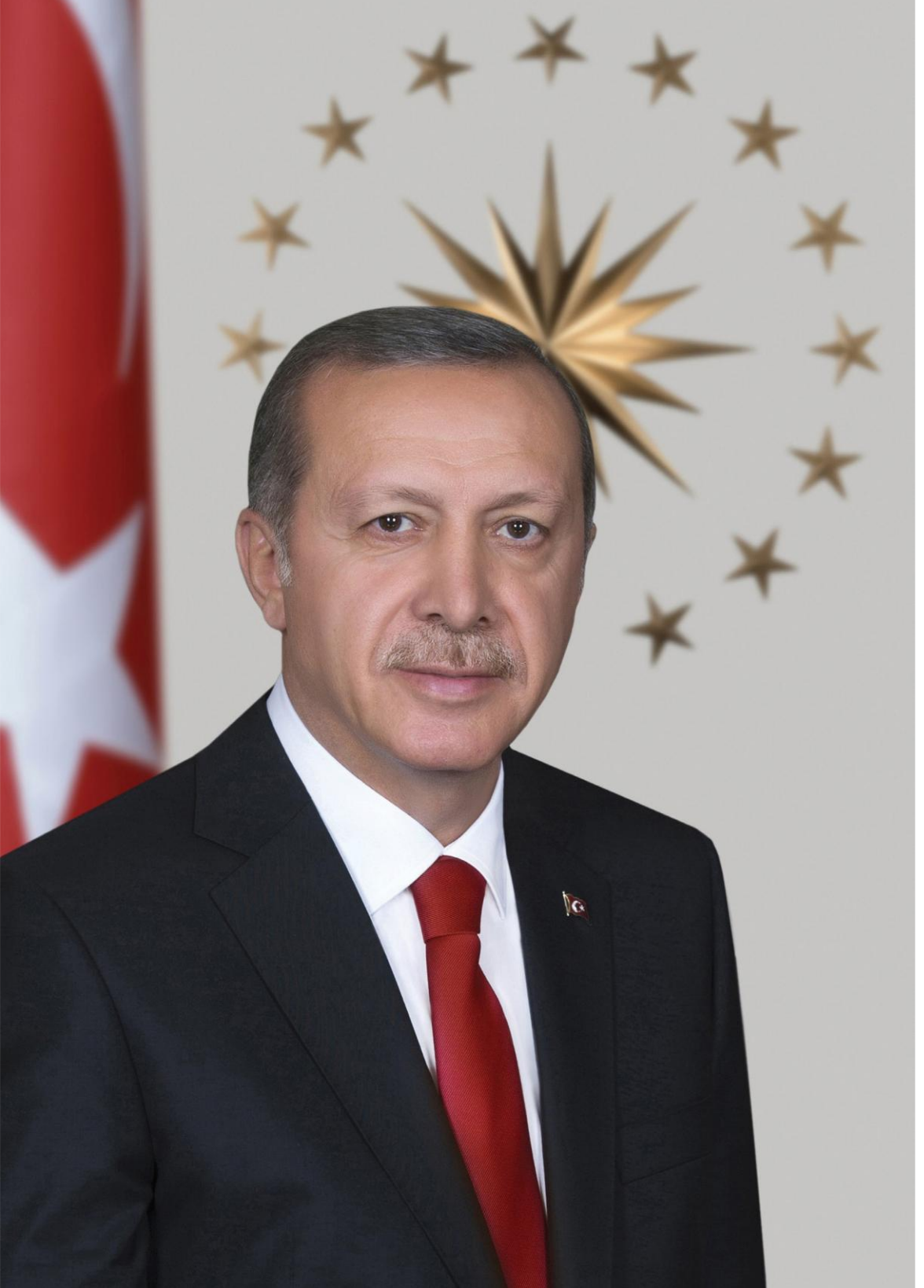
Recep Tayyip ERDOĞAN Cumhurbaşkanı