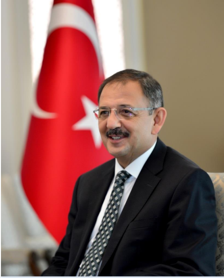
Mehmet ÖZHASEKİ Çevre ve Şehircilik Bakanı

“Yaşanabilir Çevre ve Kimlikli Şehirler öngörüsüyle çevre ve şehircilik alanında geniş bir görev ve sorumluluk üstlenmiş olan Bakanlığımız; şehirlerimizin kimlikli, mekân kalitesi yüksek, üstyapısı yeterli, altyapısı sağlam, afetlere dayanıklı ve çevreye duyarlı bir biçimde gelişmesi için çalışmalarını sürdürmektedir.