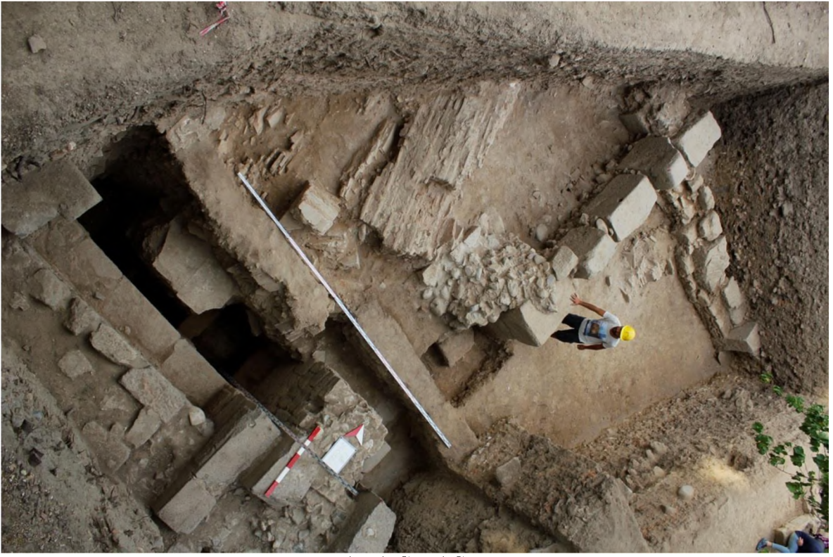
E Bölgesi, Genel Görünüm

Bu bölgeden ele geçen, 2014 yılı envanterlik buluntuları arasında, üzerinde çalışmaların devam ettiği bir tekil buluntu dikkat çekicidir. Kabaca, M.S. 11. yy'a tarihlenen Konstantinopolis Patriklik Mührü, konstekstiyle birlikte değerlendirildiğinde, E Bölgesi'nde, tahkimli ve mozaik döşemeli avlusuyla, döneminin ihtişamlı bir yapısı olduğunu açığa vuran tüm kompleksin işlevi için de önemli ipuçları vermektedir.