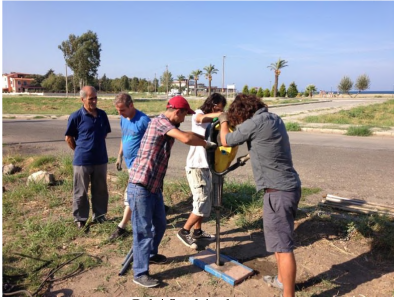
Delgi Sondaj çalışması