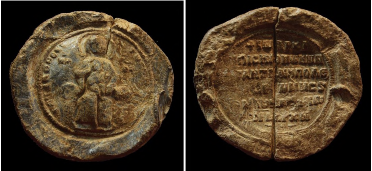
E Bölgesi buluntusu, Bizans Mührü

Bu bölgeden ele geçen, 2014 yılı envanterlik buluntuları arasında, üzerinde çalışmaların devam ettiği bir tekil buluntu dikkat çekicidir. Kabaca, M.S. 11. yy'a tarihlenen Konstantinopolis Patriklik Mührü, konstekstiyle birlikte değerlendirildiğinde, E Bölgesi'nde, tahkimli ve mozaik döşemeli avlusuyla, döneminin ihtişamlı bir yapısı olduğunu açığa vuran tüm kompleksin işlevi için de önemli ipuçları vermektedir.