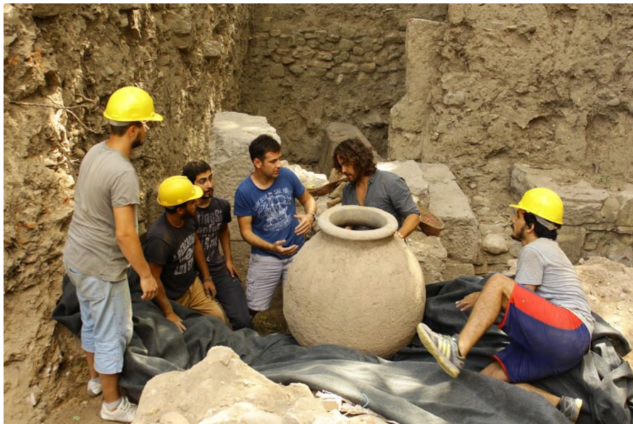
E Bölgesi, askıya çıkan Pithos'un depoya nakli