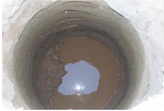
Resim 31: D Bölgesi, kuyu detay

Buluntular, nicelik olarak oldukça az olup küçük fragmanlar halindeki M.Ö. 4. yüzyıldan M.S. 6. yüzyıla kadar giden keramiklerden oluşmaktadır.