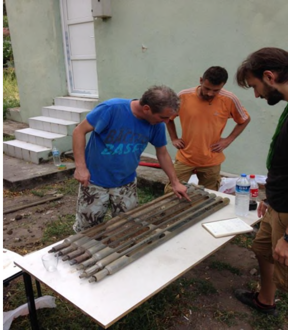
Delgi Sondaj çalışması, analiz