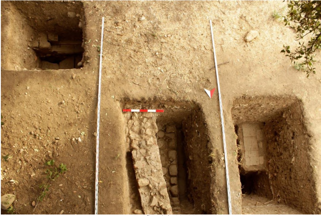
Sondaj, 18, 20, 21

2014 yılı çalışmalarında alandaki D Bölgesi Güney (DBG) olarak adlandırılan açmada ana kayaya oyularak yapılmış olan ve bulunduğu yapının ihtiyacını karşılamaya dönük tasarlanmış su kuyusunun içinde, nitelikli arkeolojik malzemenin bulunabilme ihtimali üzerine çalışılmaya başlanmıştır. Çalışma, 15/09/2014 tarihinde başlatılmış ve kuyunun zemin seviyelerine yaklaşıldığında adeta günümüzde de işlerliğini gösterir nitelikte tabanın su ile dolarak alanın çalışılmayacak hale gelmesi nedeniyle 18/09/2014 tarihi itibarıyla çalışma sonlandırılmıştır.