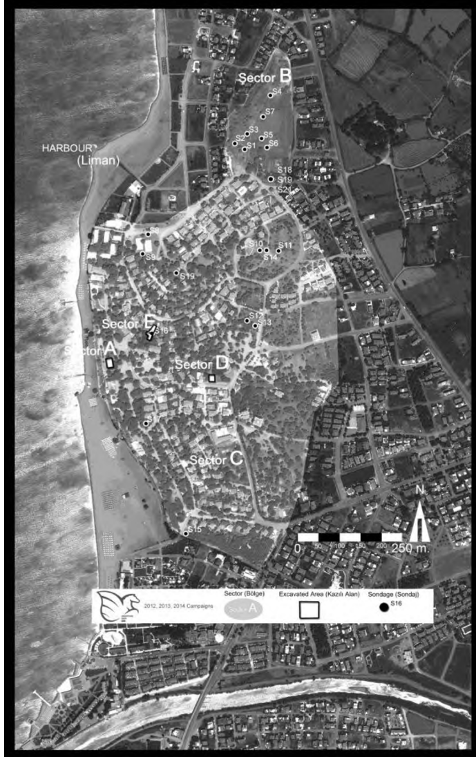
2012 – 2013 -2014 Çalışma Bölgeleri ve Sondajlar