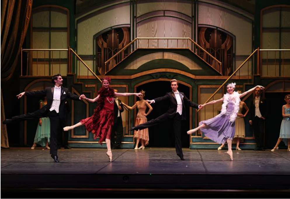
Mersin DOB – “MUHTEŞEM GATSBY” Bale (23/12/2023)