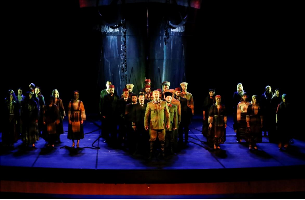
“Yeniden Doğuş” Operası