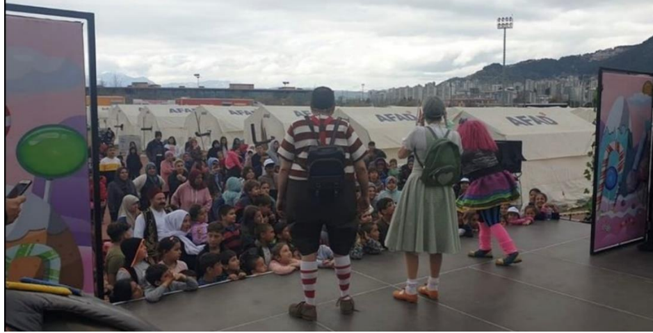
Kahramanmaraş Sütçü İmam Üni. Çadırkent

6 Şubat 2023 tarihinde meydana gelen depremler nedeniyle etkilenen bölgelerde yaşanan depremzede çocuklarımıza yönelik olarak moral ve motivasyon sağlanması amacıyla turneler düzenlenmiş olup, Adıyaman, Diyarbakır, Elâzığ, Gaziantep, Hatay, Kahramanmaraş, Kilis, Malatya, Osmaniye ve Şanlıurfa illerimizde 50 adet çocuk oyunu sahnelenmiş ve 19.954 çocuk ve aileye ulaşılmıştır.