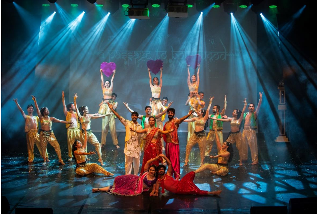
“A Passage to Bollywood” (Navdhara Hindistan Dans Tiyatrosu) – 20. Uluslararası Bodrum Bale Festivali