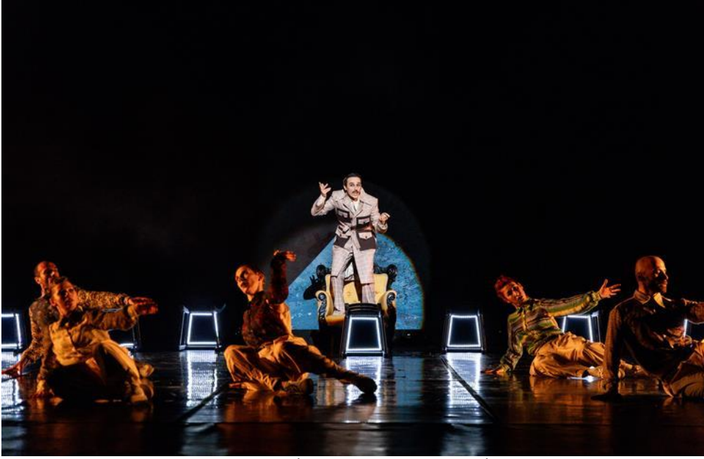
İstanbul Modern Dans Topluluğu (MDTİst) – “DANS ADRENALİN” Modern Dans (04/11/2023)