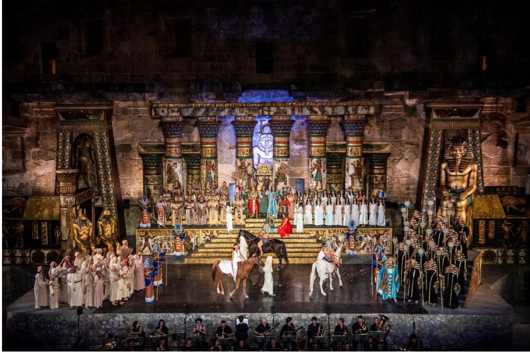
“Aida” Operası – 30. Uluslararası Apendos Opera ve Bale Festivali

Bunların dışında; Bakanlığımızca düzenlenmiş olan Nevşehir – Kapadokya Balon ve Kültür Yolu Festivali (5-13 Ağustos 2023), Trabzon – Sümela Kültür Yolu Festivali (19-27 Ağustos 2023), Erzurum – Palandöken Kültür Yolu Festivali (19-27 Ağustos 2023), Çanakkale – Troya Kültür Yolu Festivali (9-17 Eylül 2023), Ankara – Başkent Kültür Yolu Festivali (16 Eylül-1 Ekim 2023), Beyoğlu Kültür Yolu Festivali (30 Eylül-15 Ekim 2023), Diyarbakır – Sur Kültür Yolu Festivali (14-22 Ekim 2023), İzmir – Efes Kültür Yolu Festivali (28 Ekim-5 Kasım 2023) ve Antalya Kültür Yolu Festivali 'ne (4-12 Kasım 2023) katılım sağlanmıştır.