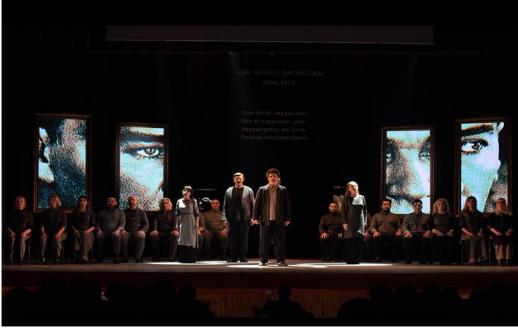
İzmir DOB – “AŞIK VEYSEL SAHNE KANTATI”, Kantat (21/03/2023)