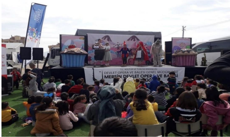
Gaziantep – İslâhiye