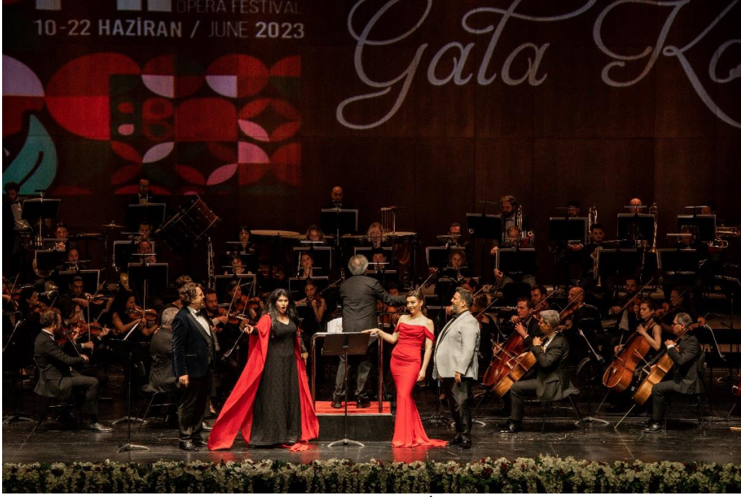
Gala Konseri – 14. Uluslararası İstanbul Opera Festivali