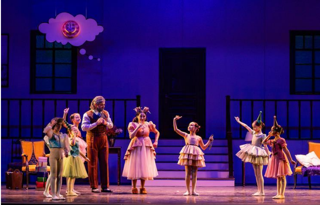
İstanbul DOB – “HAYAL”, Çocuk Oyunu (15/10/2023)