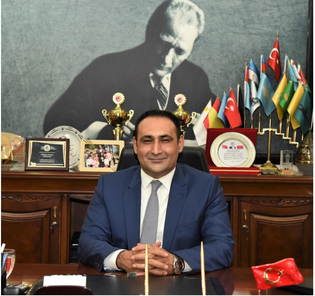
Atsız Afşın YILMAZ TOROSLAR BELEDİYE BAŞKANI