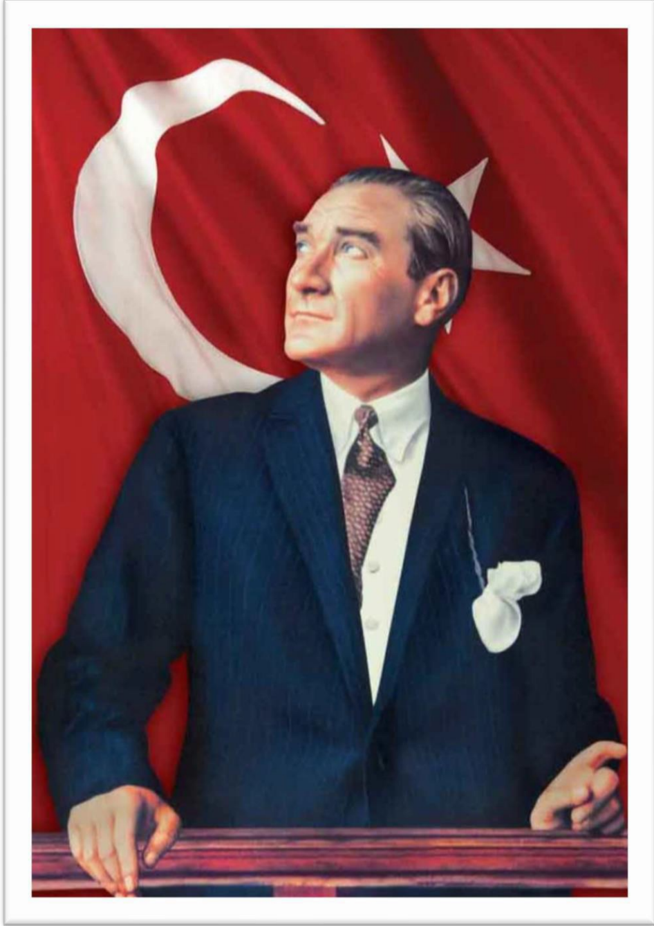
Gazi Mustafa Kemal ATATÜRK