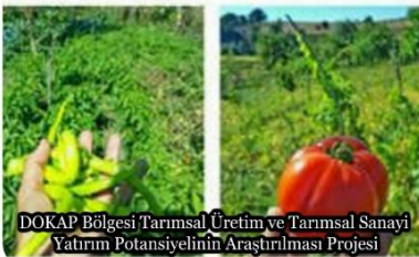
DOKAP Bölgesi Tarımsal Üretim ve Tarımsal Sanayi Yatırım Potansiyelinin Araştırılması Projesi