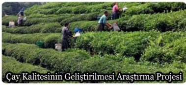
Çay Kalitesinin Geliştirilmesi Araştırma Projesi

Gerektiği ve uygulanabildiği yerlerde rüzgar ve fotovoltaik güneş enerjisi de projeye dahil edilerek enerji kaynaklarında çeşitlilik sağlanacak ve sürdürülebilir bir enerji üretim sistemi oluşturulacaktır.