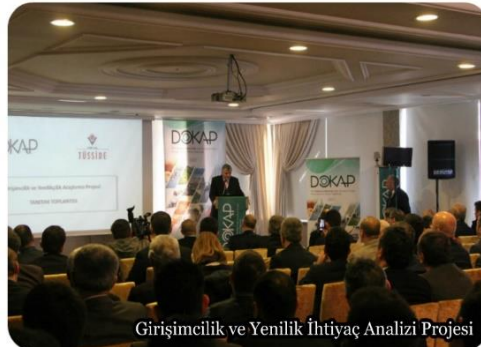
Girişimcilik ve Yenilik İhtiyaç Analizi Projesi