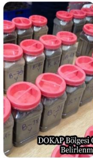
DOKAP Bölgesi Organik Tarım Havzalarının Belirlenmesi Araştırma Projesi