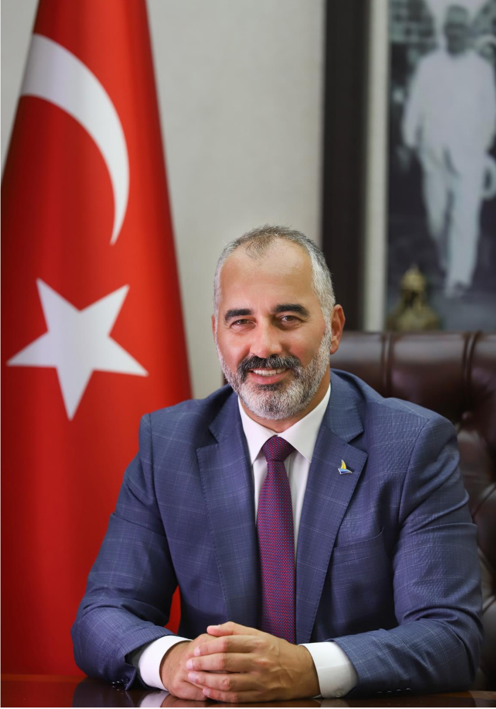
İSMAİL YILDIRIM KARAMÜRSEL BELEDİYE BAŞKANI