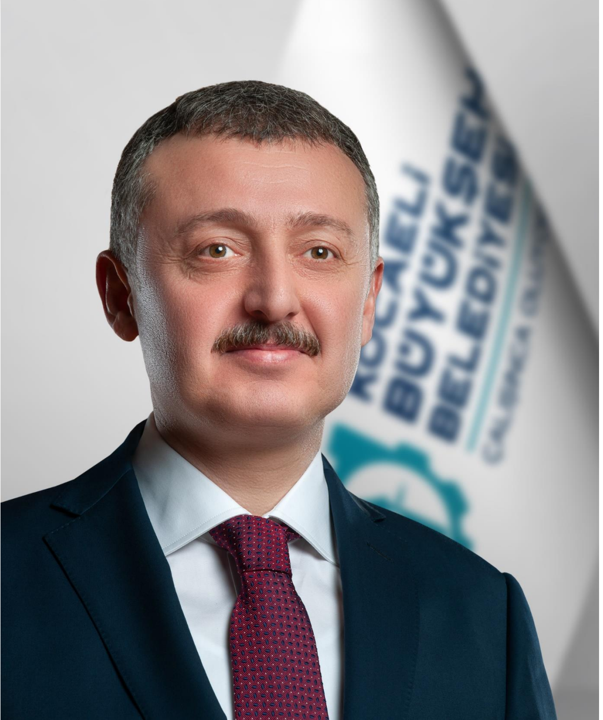
TAHİR BÜYÜKKAKIN KOCAELİ BÜYÜKŞEHİR BELEDİYE BAŞKANI