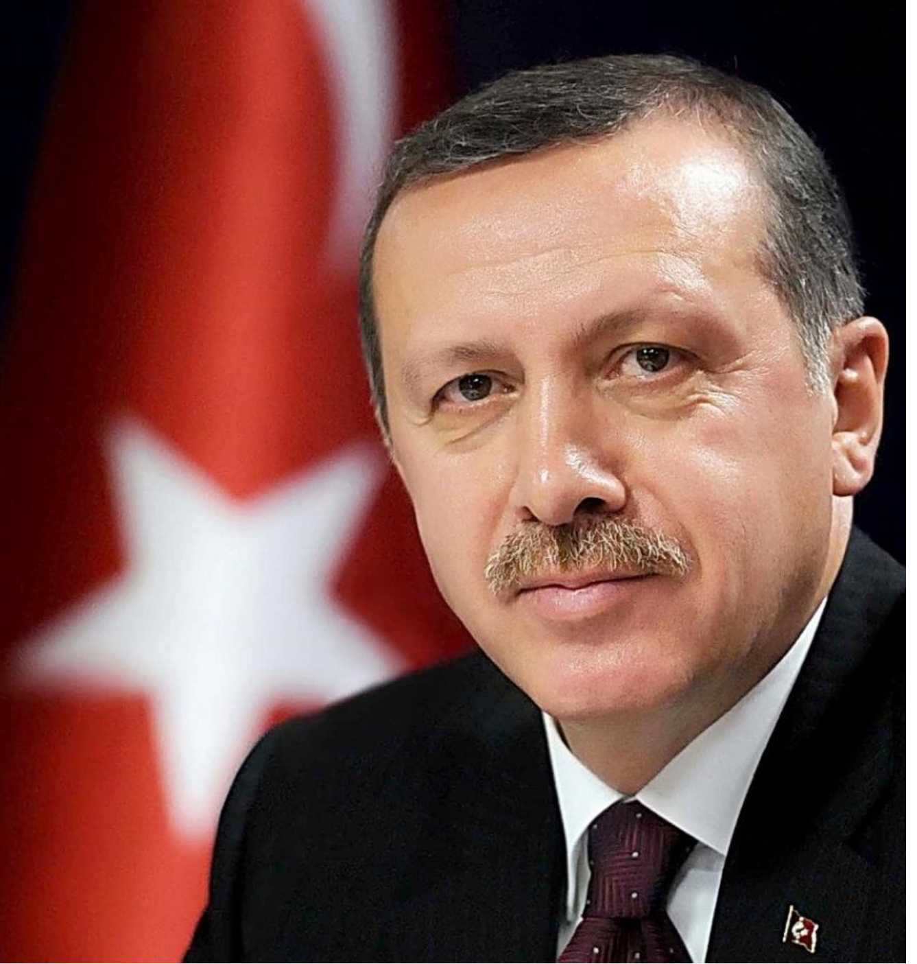
RECEP TAYYİP ERDOĞAN CUMHURBAŞKANI