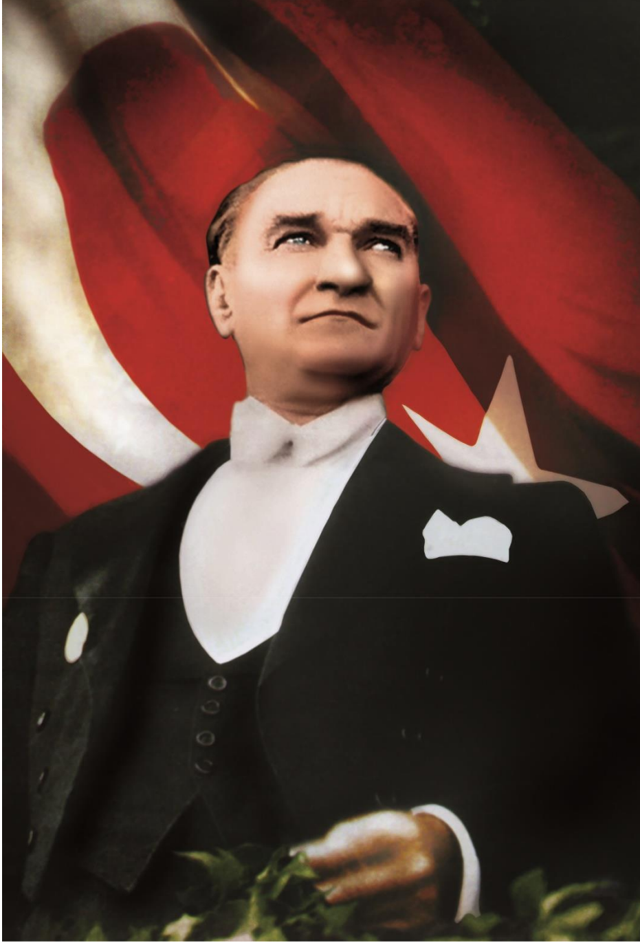
MUSTAFA KEMAL ATATÜRK TÜRKİYE CUMHURİYETİ KURUCUSU