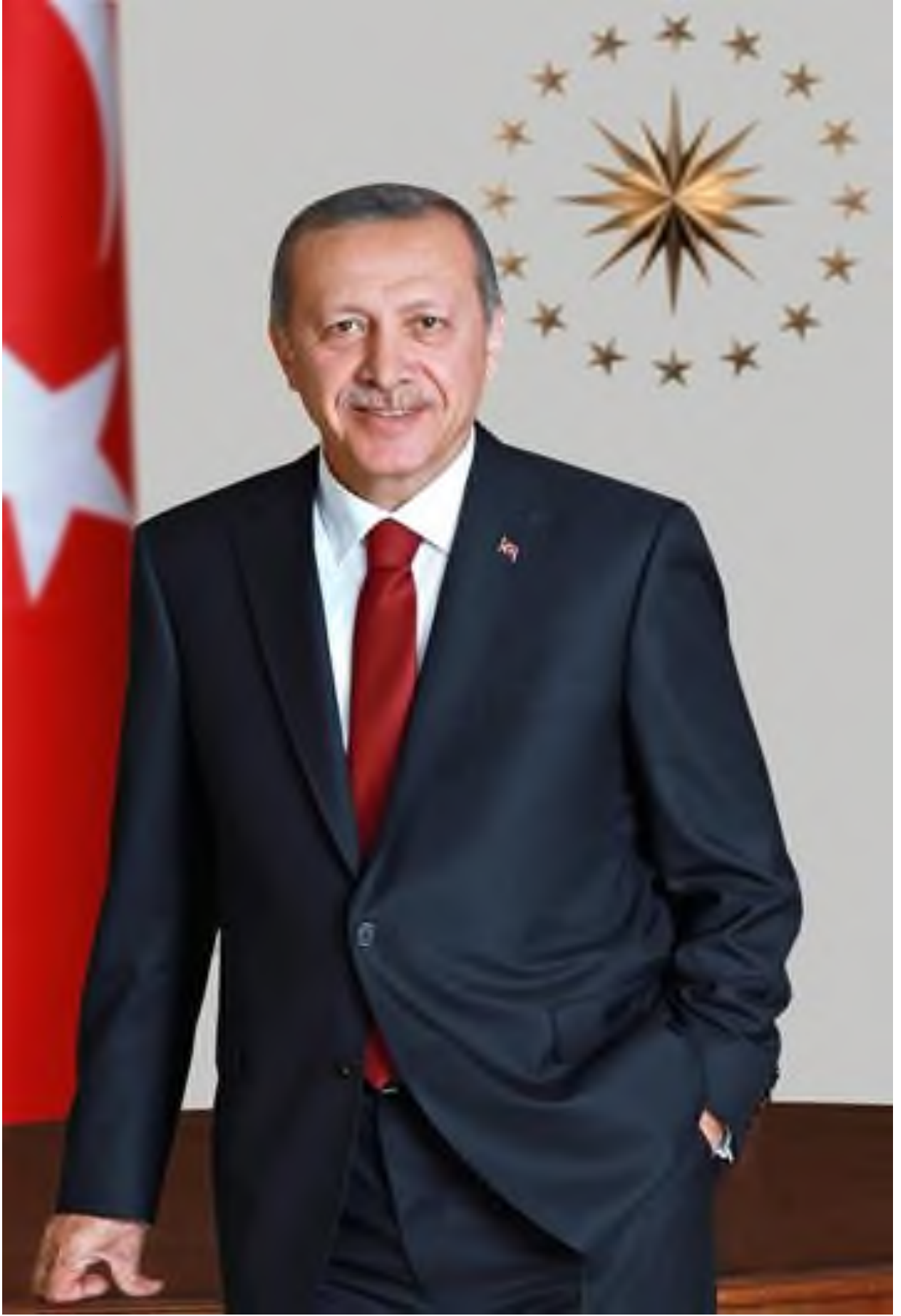
Recep Tayyip ERDOĞAN Cumhurbaşkanı