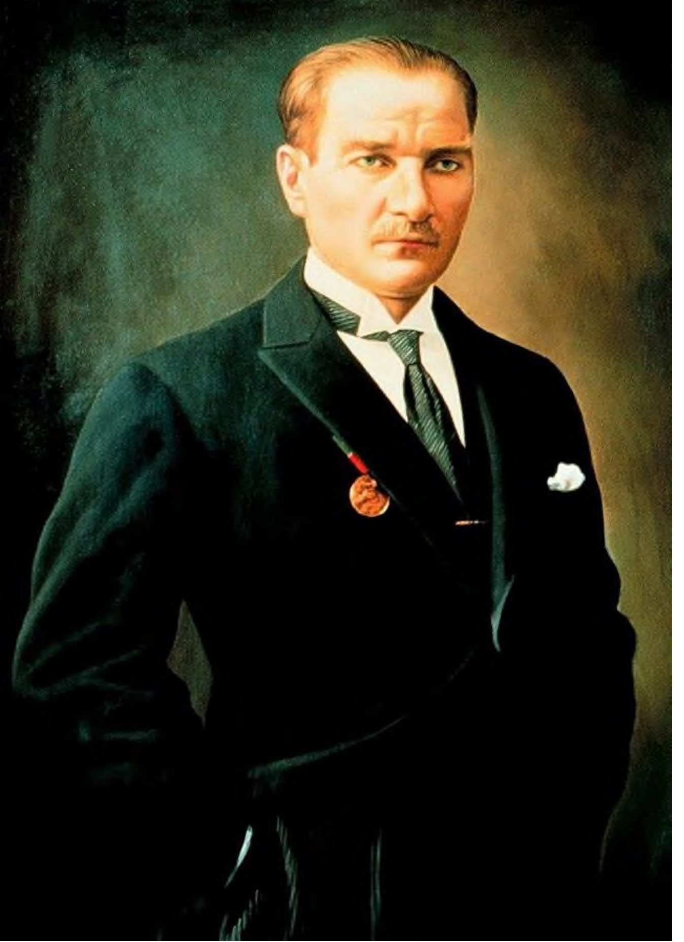
Mustafa Kemal ATATÜRK