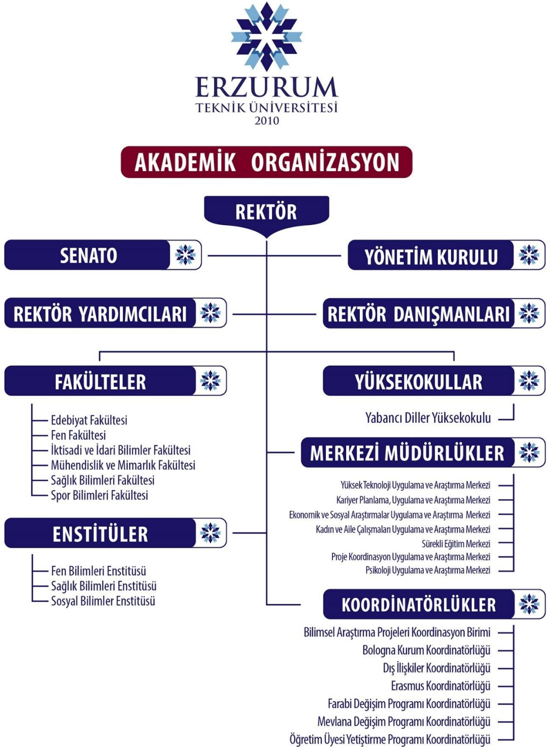
Şekil 1: Erzurum Teknik Üniversitesi Akademik Birimler Organizasyon Şeması