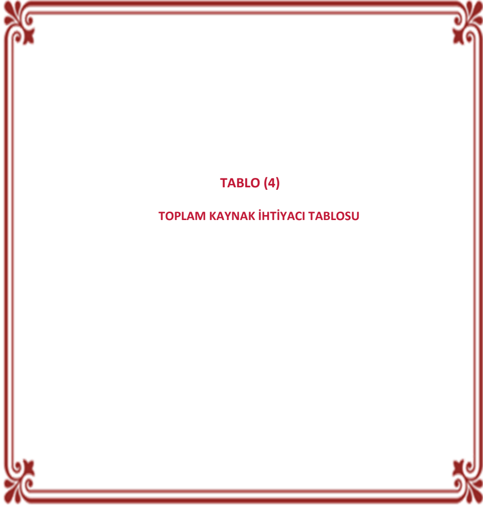
TABLO (4) TOPLAM KAYNAK İHTİYACI TABLOSU