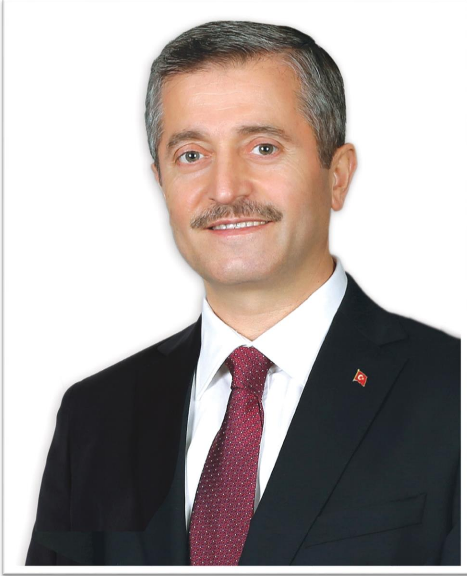
MEHMET İHSAN TAHMAZOĞLU ŞAHİNBEY BELEDİYE BAŞKANI