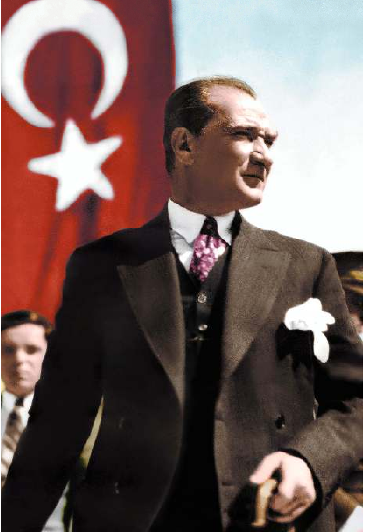
Mustafa Kemal ATATÜRK TÜRKİYE CUMHURİYETİ KURUCUSU