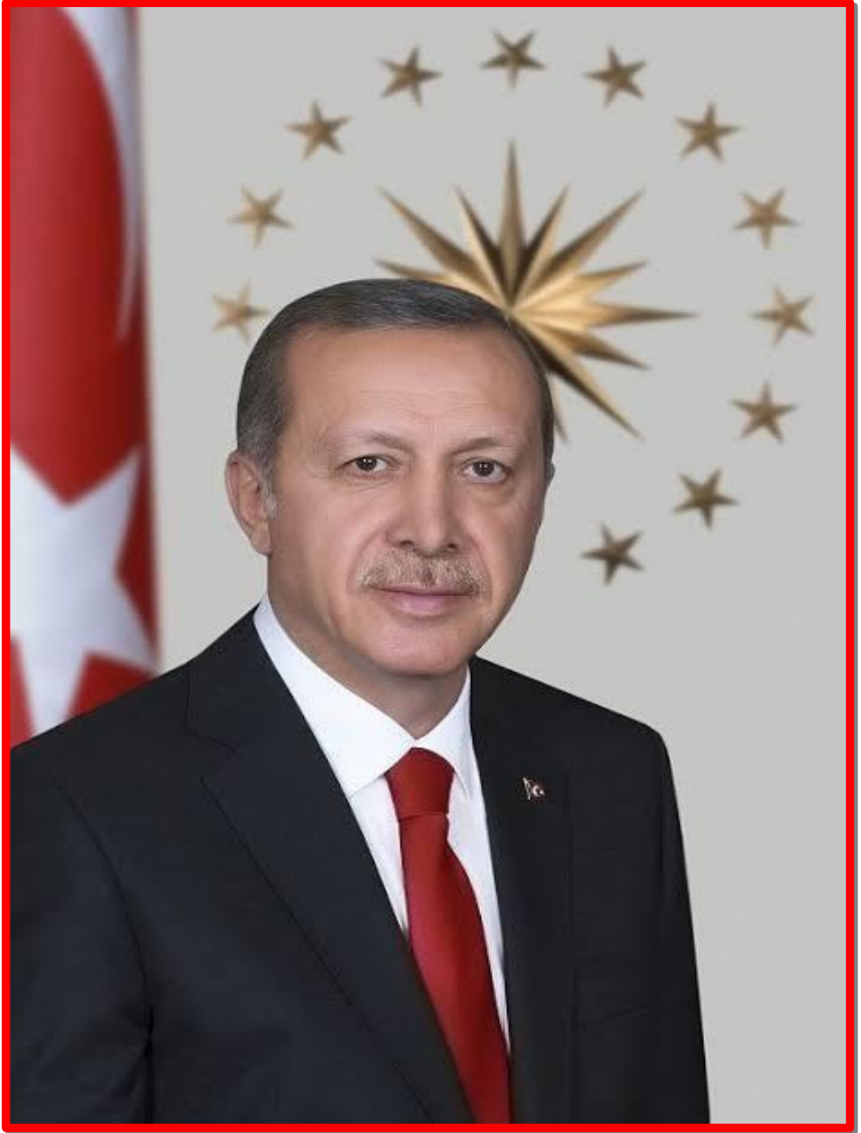
CUMHURBAŞKANI RECEP TAYYİP ERDOĞAN