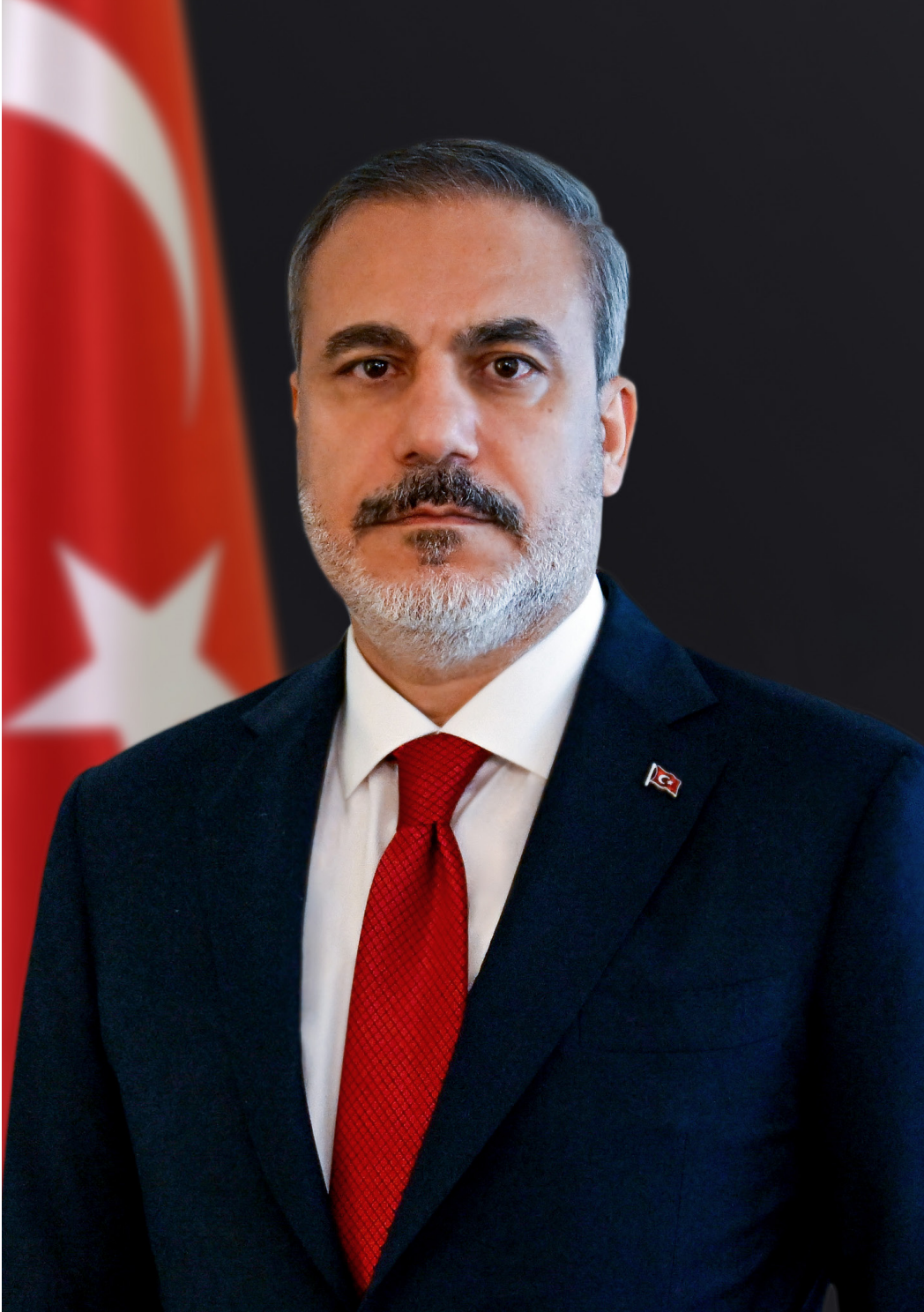
Hakan FİDAN DıŐiŐleri Bakanı